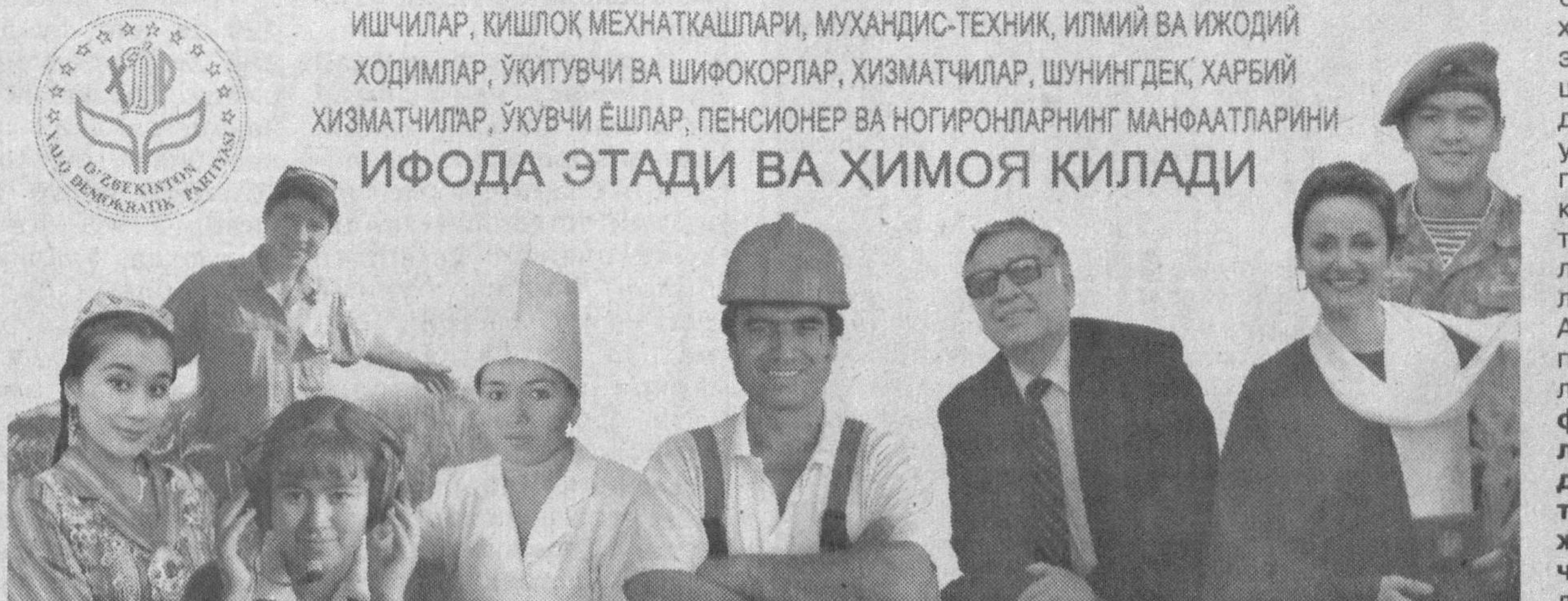
ИШЧИЛАР, КИШЛОҚ МЕХНАТҚАШЛАРИ, МУХАНДИС-ТЕХНИК, ИЛМИЙ ВА ИЖОДИЙ ХОДИМЛАР, ЎҚИТУВЧИ ВА ШИФОКОРЛАР, ХИЗМАТЧИЛАР, ШУНИНГДЕК ҲАРБИЙ ХИЗМАТЧИЛАР, ЎҚУВЧИ ЁШЛАР, ПЕНСИОНЕР ВА НОГИРОНЛАРНИНГ МАНФААТЛАРИНИ ИФОДА ЭТАДИ ВА ҲИМОЯ ҚИЛАДИ

таъминлаш ва истеъмолчилар манфаатларига зиён етказувчи монополистик фаолиятни чеклаш; меҳнат бозори ва истеъмол бозорини тенг рақобат қила олмайдиган аҳоли заиф табақаларининг давлат томонидан кафолатланган мўлжалли ижтимоий муҳофазасини таъминлаш тарафдоридир.