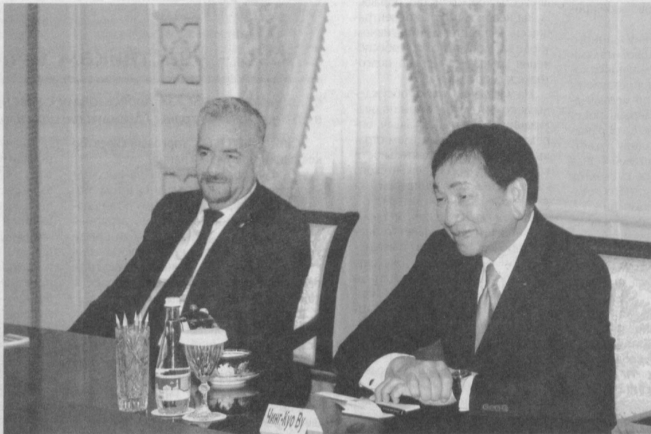
Президент Республики Узбекистан Ислам Каримов 15 июля в резиденции Оксарой принял президента Международной ассоциации любительского бокса (AIBA) Чинг-Куо Ву.

Визит Чинг-Куо Ву в нашу страну проходит в рамках его участия в заседании Исполнительного комитета AIBA в Ташкенте. Данный спортивный форум является завершающим звеном в процессе подготовки Международной ассоциации любительского бокса к предстоящим Олимпийским играм в Бразилии.