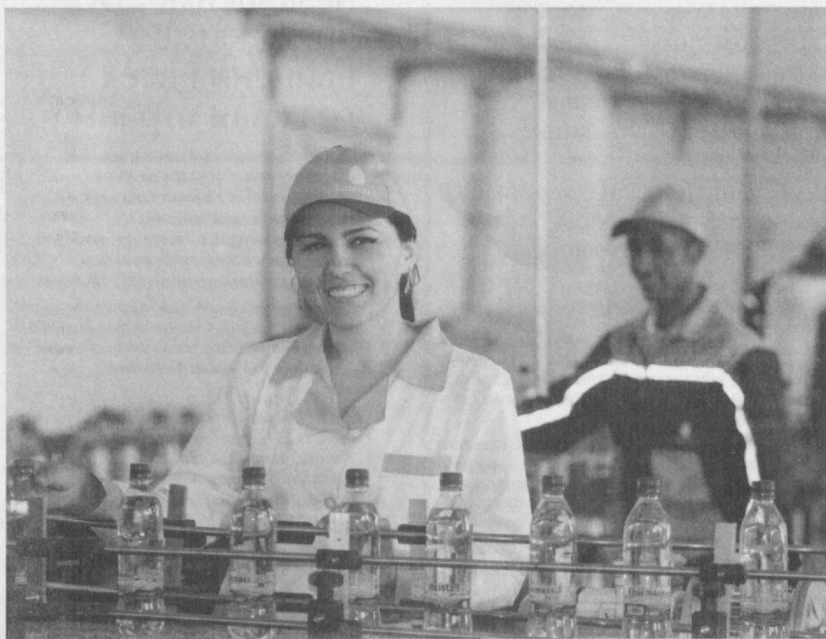
Общество с ограниченной ответственностью "Учкургон Кристалл" Учкурганского района Наманганской области специализируется на разливе чистой питьевой воды и производстве прохладительных напитков.

В результате созданной под руководством Президента нашей страны благоприятной деловой среды организованное в нынешнем году предприятие было оснащено современными тех-