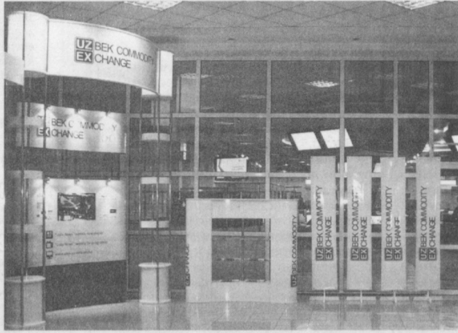
мало бизнеса во все сферы деятельности".

"Малый бизнес в Узбекистане - это важнейший элемент экономики, я бы даже сказал ее фундамент, основа процветания. В первую очередь, со временем многие ныне малые предприятия превращаются в крупные производственные компании. Диверсификация производства, расширение штата и географии экспорта - этому будут способствовать многие факторы. Во-вторых, и это ключевой момент, малые предприятия стали необходимым условием для функционирования на должном уровне крупных компаний, от которых зависит промышленная инфраструктура и индустриальный потенциал страны в целом. Опыт моей работы показывает, что для эффективной и полноценной работы одной крупной компании необходима тысяча небольших предприятий. С этой точки зрения корпоративные закупки в Узбекистане - это один из тех важнейших рыночных механизмов, который гарантирует непрерывность экономического развития и создает огромный стимул для еще более глубокого проникновения