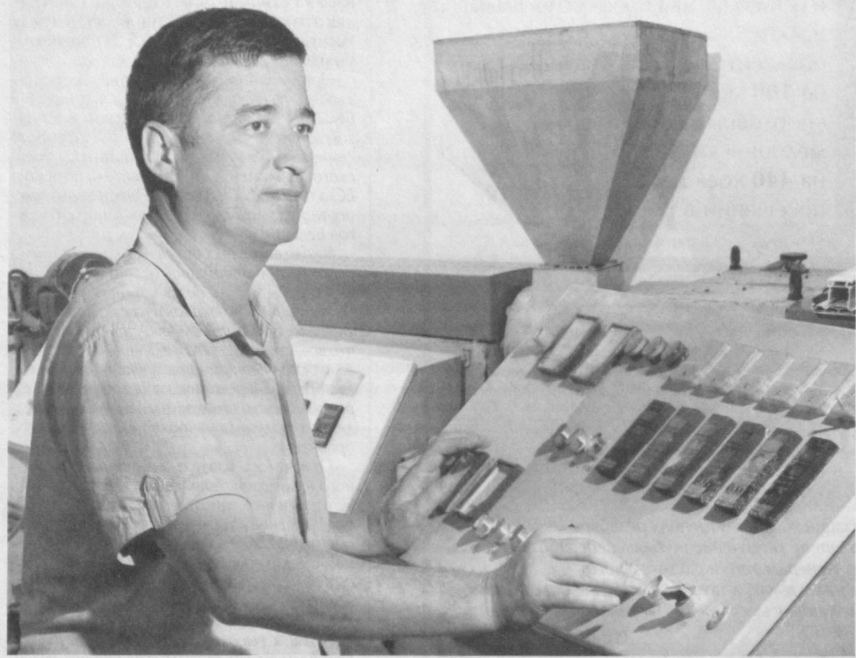
В технопарке Сергийского района столицы более ста субъектов предпринимательства. Среди предприятий, расположенных на 20 гектарах, лидируют несколько основных направлений деятельности - швейное, мебельное производство, выпуск стройматериалов, автосервисные услуги.

Одно из самых успешных - ООО "ПВХ махсулотлари", специализирующееся на выпуске уплотнителей для окон и дверей из ПВХ и водяных шлангов. Продукция востребована на рынке: пластиковые двери - достойный конкурент деревянным, уплотнители к