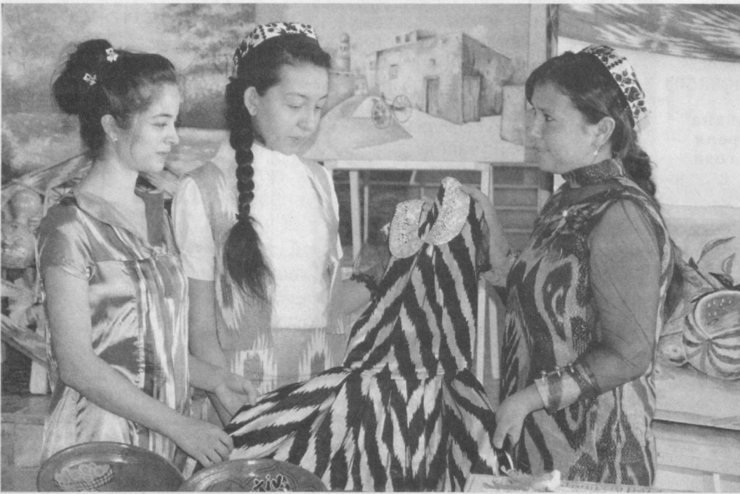
В Хорезме состоялся областной этап конкурса "Лучший проект женщины-предпринимателя", прошедший под девизом "Жизнь моя, судьба моя - родной мой, неповторимый Узбекистан!"

Участницы соревновались в трех номинациях - "Лучший проект в сфере производства", "Лучший проект в сфере сервиса" и "Лучший проект для сельской местности". Победительницами и призерами областного этапа стали шесть девушек.