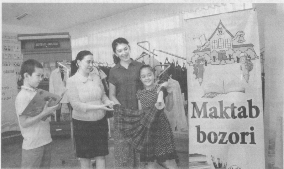
В рамках выставки школьных учебных принадлежностей, литературы, одежды и обуви в Республиканской детской библиотеке состоялся брифинг, в котором приняли участие отечественные производители, представители организаций, ответственных за проведение ярмарок, и широкой общественности.

Министерство народного образования представило широкий ассортимент литературы для общеобразовательных школ на узбекском, русском и других языках. Также посетители смогли ознакомиться со всеми возможными вариантами школьной формы.