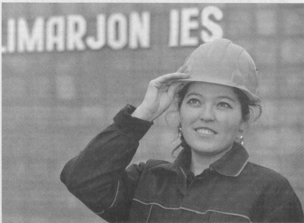
Унитарное предприятие "Талимаржон иссилик электр станицяси" Нишанского района Кашкадарьинской области - одно из крупных объектов энергетической промышленности нашей страны.

На предприятии, являющемся важным звеном единой энергетической системы страны, реализуются меры по повышению уровня обеспечения потребителей электроэнергией, внедрению в производство современных и высокоэффективных технологий, разви-