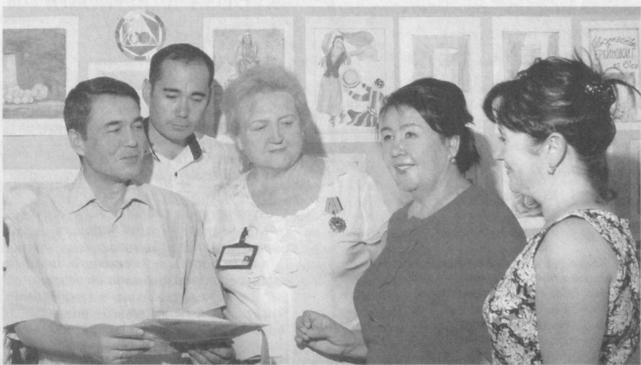
В преддверии нового учебного года преподаватели общеобразовательных школ Ташкентской области приняли участие в научно-практических семинарах "Повышение качества и внедрение передовых педагогических технологий в начальное образование". Встречи прошли в Кибрайском, Янгильском районах и Алма-Аты. Учителя обсудили тенденции и направления преподавания тех или иных предметов, в том числе иностранных языков и точных наук в начальных классах, использование наглядных пособий и широкого внедрения интерактивных методов. Отмеча-

лось, что на современном этапе важно помочь детям не просто заучивать информацию, а четко и грамотно излагать свои мысли, использовать дополнительную литературу.