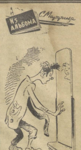
О, если б бракдел свой брак надевал!

Относительно прохладными ожидаются начало и середина июля. В пятый патнаеке днем будет 20-34 градуса. И еще сюрпризы июля: дождь. Как известно, в эту пору в нашей республике они выпадают очень редко. Дожди летнего характера, местами с грозами пройдут по Ташкентской области и Ферганской долине с 4 по 10, с 14 по 24 и 27 июля. Жарко — до 35-40 градусов с 11 по 18 июля. В последние дни июля будет 20-25, 20-31 июля. В целом же месяц ожидается не очень жарким, за исключением восточных районов Каракалпакии. Среднемесячная температура на большей части Узбекистана будет от 27 до 32 градусов, в Ферганской долине — от 20 до 25 градусов. А. АВАНЕСОВА. Начальник отдела долгосрочных прогнозов управления гидрометеослужбы республики.