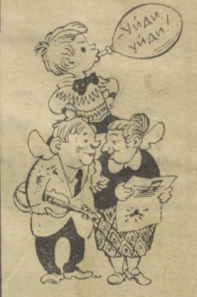
Талант! Выдержки!!! Быстрее в консерваторию!