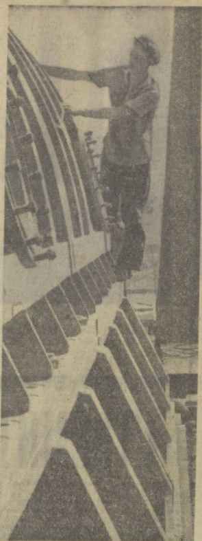
Ташкентская ГРЭС. Коллектив монтажников ведет монтаж пятого турбогенератора, который вступит в эксплуатацию в этом году и даст еще 150 тысяч киловатт электроэнергии.