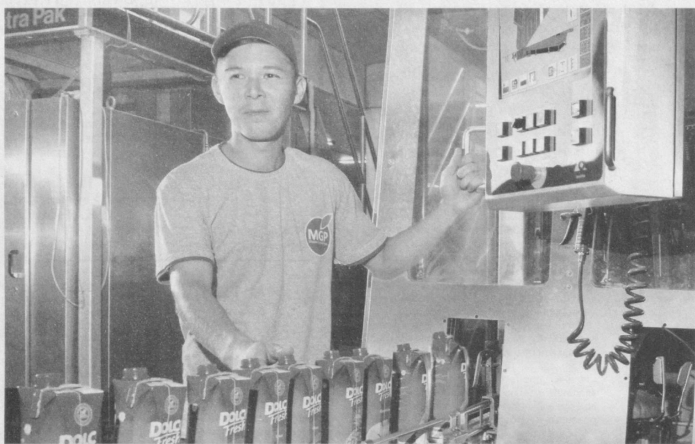
Вкусные и полезные соки выпускает Янгйюльская компания "Master global plus".

В цехах предприятия установлено современное оборудование, позволяющее производить не только большое количество соков, но и фруктовые пюре, томатную пасту и другое. В торговую сеть продукция поступает под маркой "Dolce", "Fresh" и "Sabo". В соках и нектарах, получаемых из фруктов и овощей, выращиваемых фермерами, нет консервантов, красителей и искусственных пищевых добавок.