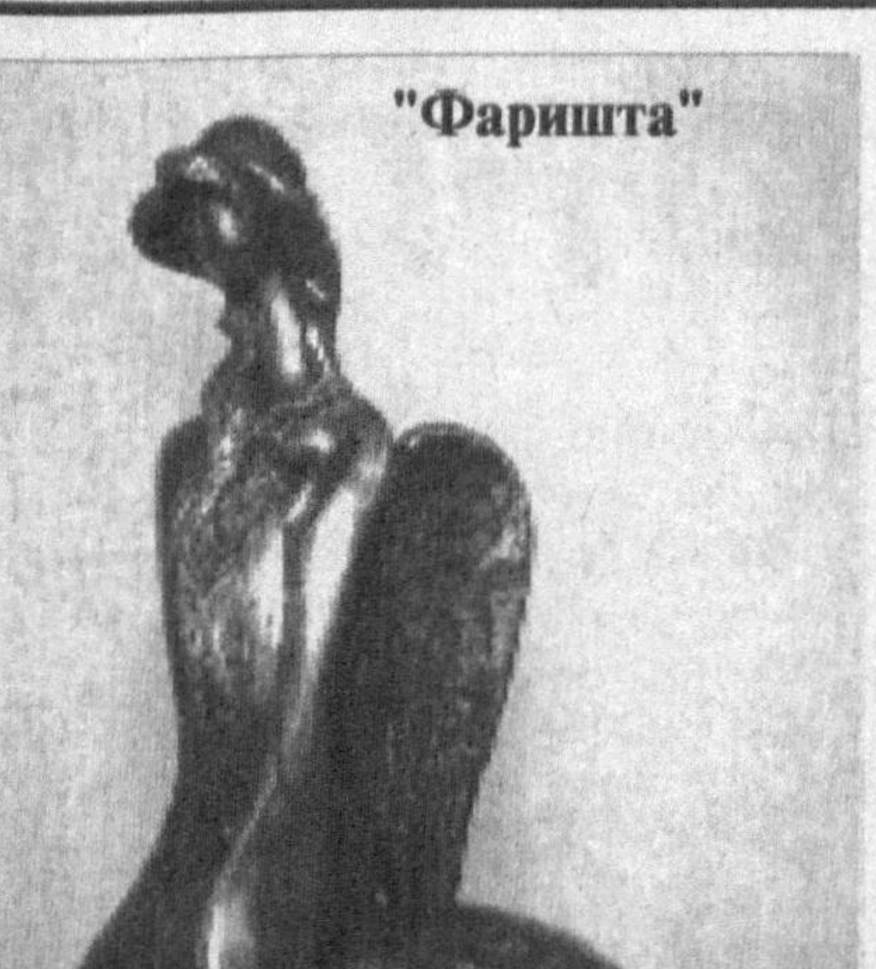
"Фаришта" Дилфуза КАМОЛ

рида гўзал руҳий эврилишлар, аёл нуфусининг айланиши ифборлари, боқира озуларини, ниқатлари, гўзалликка талпинишлари, бахт истаги, севги сурурларининг бетакрор ҳолатларини акс эттира олган. Диққатимизни торттиб, бироз ўйлатиб қўйган асар "Фаришта" бўлди. Образда маъзунлик, бир қадар чорасизлик кайфияти сезилди. Тааж-тааж, фариштанинг нима гами бўлсин. Унинг ўзи инсонларга бахт ва шодлик олиб келгувчи, бало-қазодан асрагувчи эди-ку! Ажаб, қўлида олма. Олма муҳаббат рамзи. Фариштанинг ахлоқи аён. У — ишқ аспраси. Бу муҳаббат уни на учиб кетишга қўлди, на ерга қўншга. Мусаввирнинг бу композициясида мавзу ҳам, ечим ҳам ниҳоятда ўзига хос. Гузлора Султонова аёл руҳининг ановий жилворларини топа олади ва маҳорат билан яра-