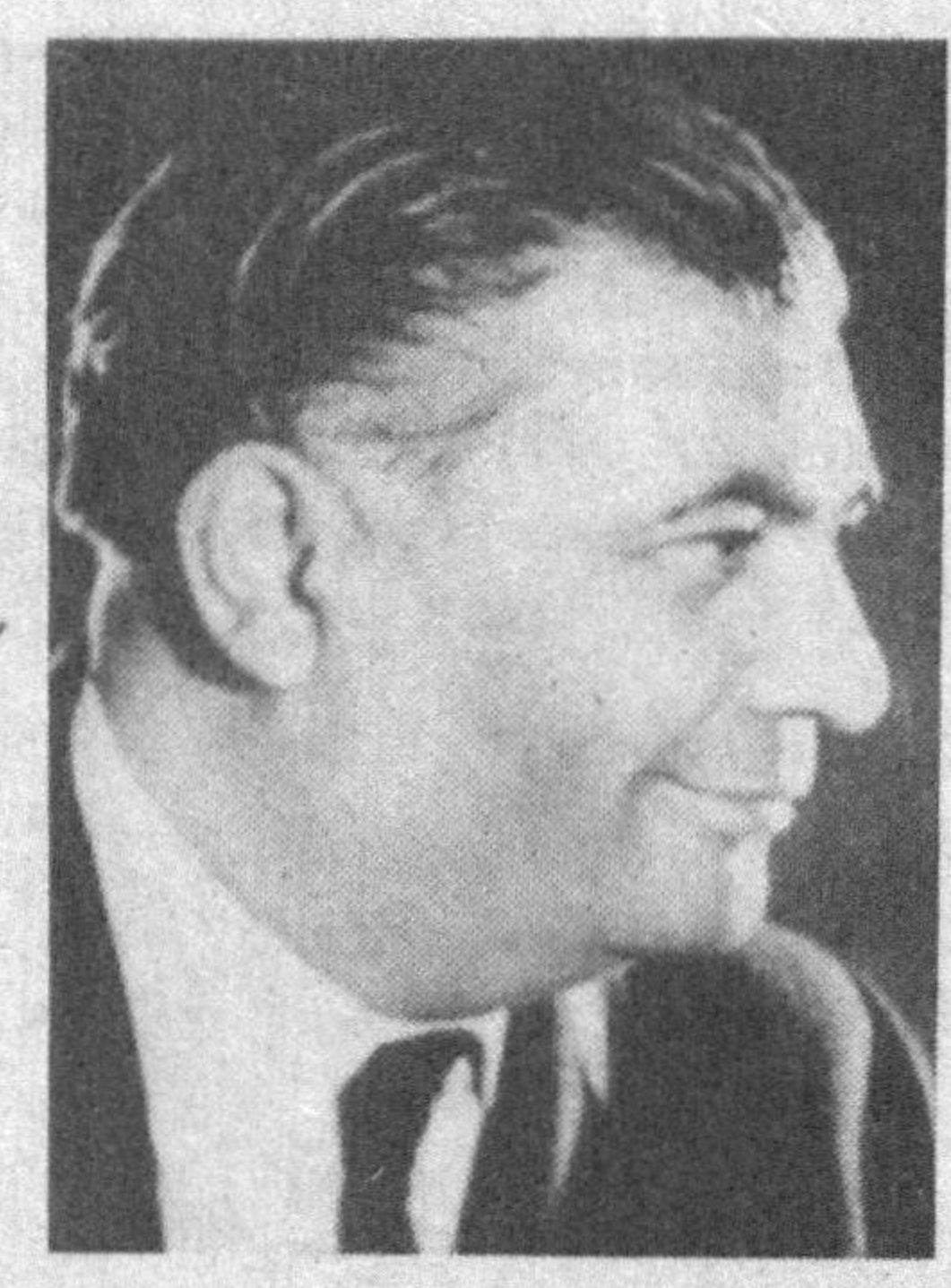
ти (бошқа театрда қўйилган) унча обрў қозонмади. Тошхўжа Хўжаев бу асарни "Шохи сўзана" деб номлаб, унга кулгили сахналар қўиши йўли билан машур комедияга ай-

Абдулла Қаҳҳорнинг "Янгиер" деб номланган асарининг дастлабки сахна вариант-