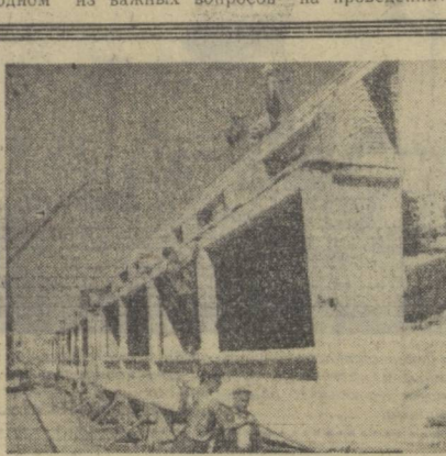
Широкую помощь в строительстве жилья оказывают пострадавшему от землетрясения населению Ташкента трудящиеся республики. Все го- рода и многие районы ведут сооружение новых домов. Наш фотокорреспондент А. Палехов побывал на ряде строительных площадок и за- снял работы, которые ведут строители (на снимках слева направо): Ангеря, Чирчика и Верхнечирчикского района.

Характерно и другое. Участники рейда в какое-то время сосредоточивают внимание на одном из важных вопросов — на проведении