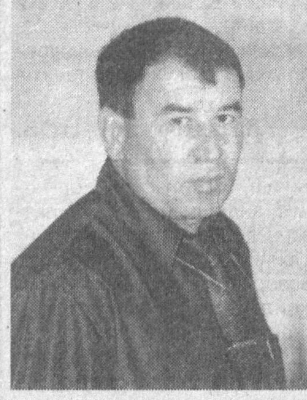
— Айтингчи, айти кунда сизнинг ва жамоа аъзоларининг кайфияти қандай?

— Асти сўраманг, бундай вақтда одамнинг қалбидан ўтаётган ҳис-туйғуларни, ҳаяжонни таърифлаш жуда қийин. 2001-2003 йилларда ушбу саволга бемалол жавоб берган бўлсам керак. Чунки, у вақтда биз меҳмон бўлиб беллашувларга киришган эдик. Бу йил эса ўзимиз мезбонимиз. Демак, шунга муносиб бўлишимиз зарур. Шогирдларимнинг кайфиятига келсак, улар ҳар доимгидан ҳам дадил, қатъиятли.