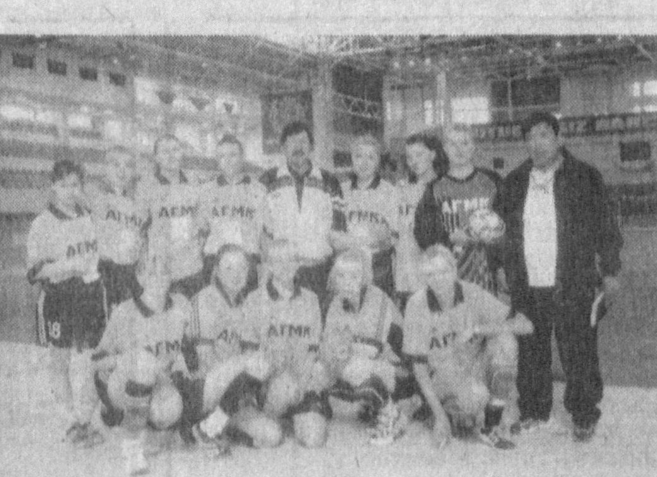
Буорган ёш спортчилар билан бир гуруҳда беллашувларга киришишди. Улар даствлабки ўйини сурхондарёлик тенқурларига қарши ўтказишди ва бу учрашув мурасоси курашларга бойлиги билан томошабинларда катта таассурот қолдирди.

Чирчиқдаги Олимпия заҳиралари коллежининг спорт манежи эрта тонгдан «Баркамол авлод - 2005» мусобақалари қатнашчилари ва муҳлислари билан гап-гап бўлди. Муқобили жихатидан республикамизда ягона саналган иншоотда ўсмирлар ва қизлар ўртасида кўла тўпи бўйича мусобақалар бошланди.