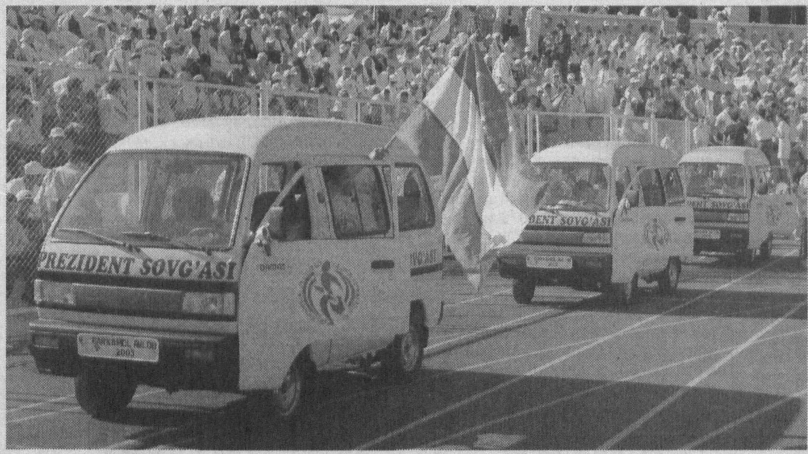
«Пилла — 2005»