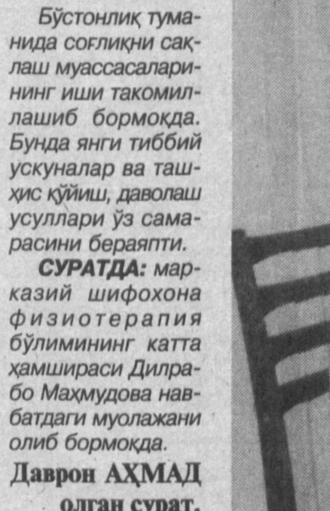
Бўстонлик туманида соғлиқни сақлаш муассасаларининг иши такомиллаштириб бормоқда. Бунда янги тиббий ускуналар ва ташхис қўйиш, даволаш усуллари ўз самарасини берапти.

→ Тошкент вилоятининг шаҳар ва қишлоқларида 95 та шифохона, амбулатория-поликлиника фаолият кўрсатмоқда. → Шаҳар ва туманлар аҳолиси 195 та қишлоқ врачлик пункти, 34 та қишлоқ врачлик амбулаторияси, 12 та стоматология поликлиникаси, 165 та фельдшер-акушерлик пункти, қўлдан қўл бошқа шифохоналарнинг тиббий хизматидан фойдаланмоқда. → Вилоят шифохоналари 1740, шаҳар марказий шифохоналари 3411, туман марказий шифохоналари 5210 ўринга эга. → «Сихат-саломатлик йили»да соғлиқни сақлаш тизимига 30 миллиард 500 миллион сўмдан ортиқ маблағ сарфланиши режалаштирилган. → Ахиратиладиган бюджет маблағларининг 52 фоизи амбулатория-поликлиника, 13,5 фоизи шовшинч тиббий хизмат кўрсатишга йўналтирилмоқда. → Вилоят тиббий муассасалари шу йилнинг ўтган мuddатида аҳолига 251 миллион сўмлик пуллик хизмат кўрсатди. → Шифо масканлари ўтган беш ой мобайнида 45 миллион сўмлик янги ташхис-даволаш ускуналари олди.