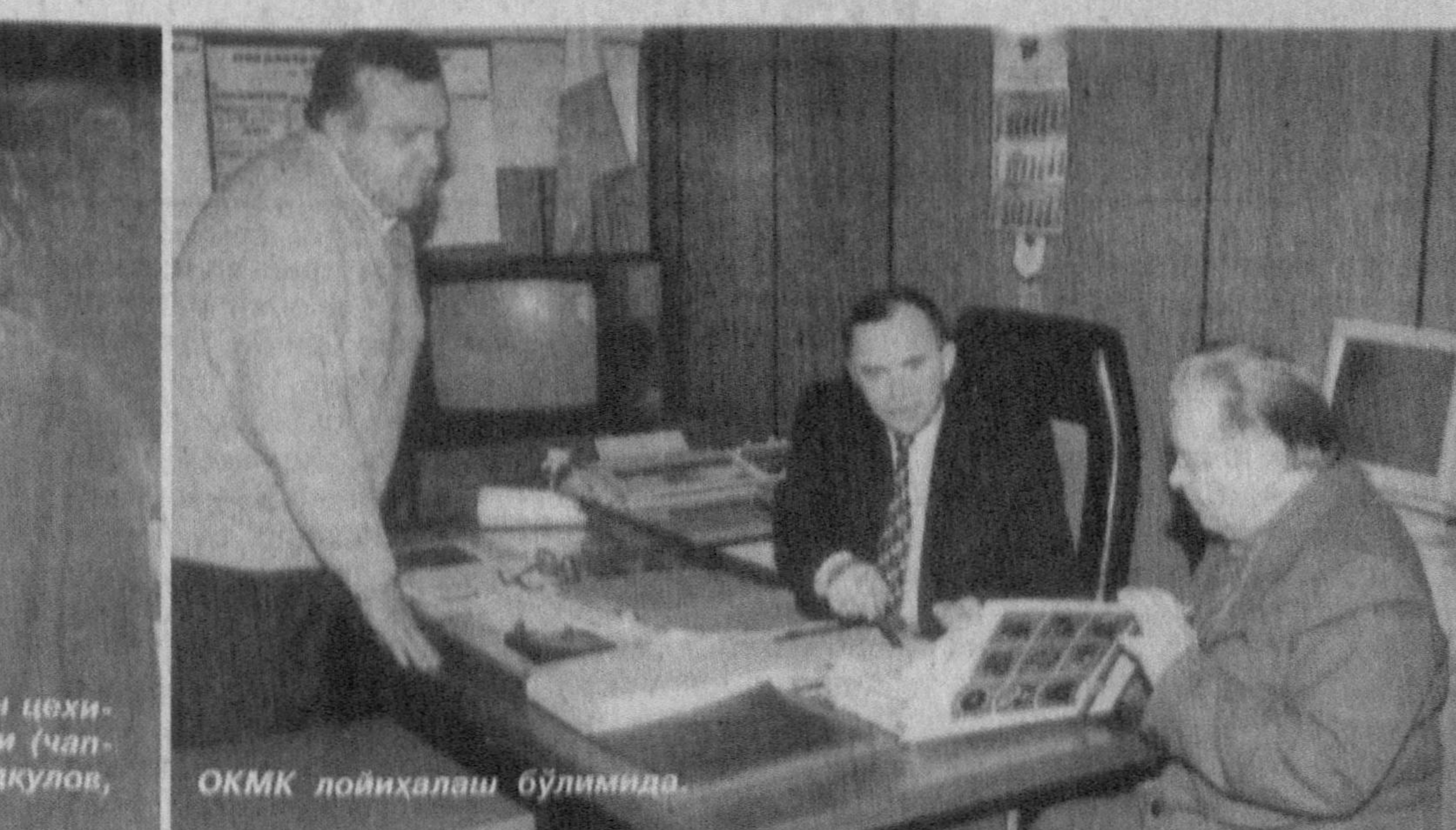
ОКМК лойиҳалаш бўлимида.