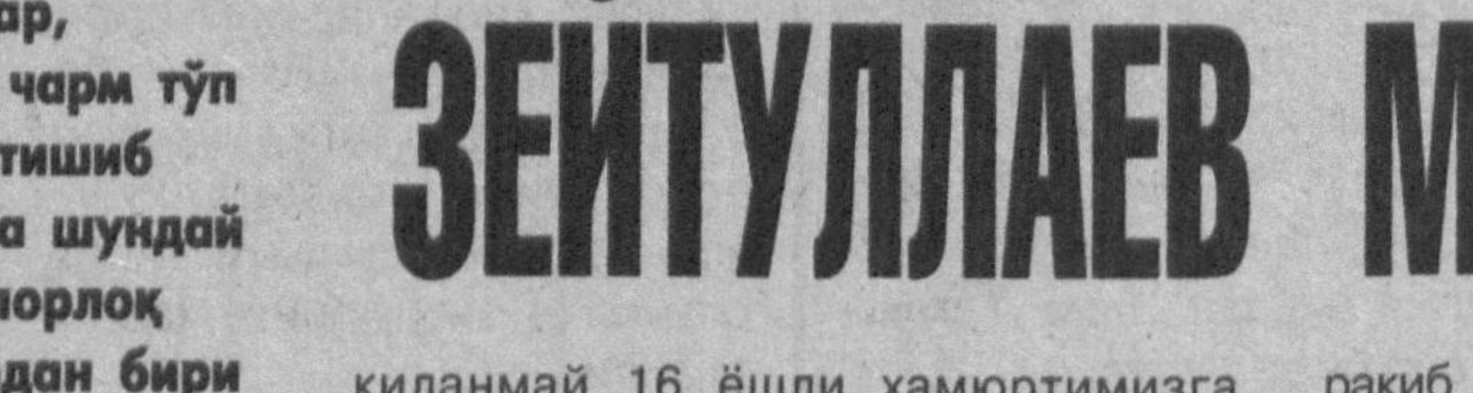
Вилоятимиз спорт юлдузлари