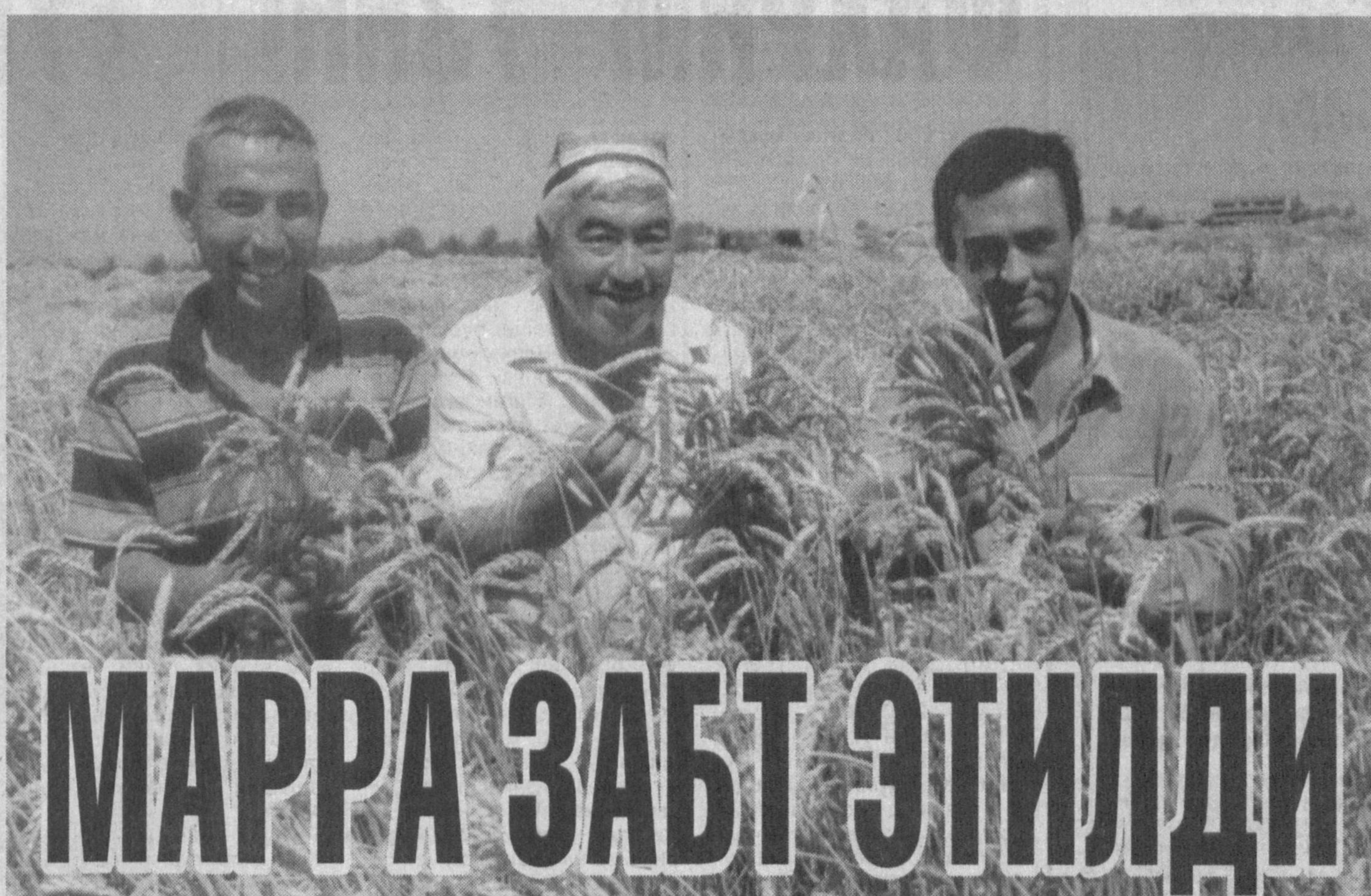
Вилоятимиз ғаллакорлари давлатга 268700 тоннадан ортиқ сара дон етказиб бериб, шартнома режасини 25 иш кунда бажардилар

Вилоятимиз деҳқонлари қўлга киритган улкан меҳнат ғалабасида кўп қадим тўман ва ҳўжаликларнинг муносиб ҳиссаси бор. Жум-