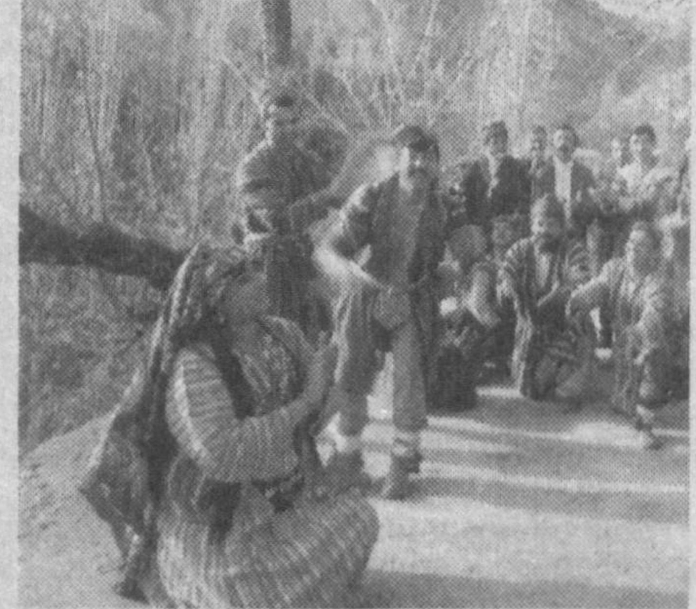
Ўроқ кесиб қўлимни ўн ой ётдим. «Қандайсан», — деб аҳволимни сўрамадинг.

Маълумки, миллий маросим ва удулар халқимизнинг тарихий ривожланиши маҳсули ўлароқ вужудга келган. Эътиборлики шундаки, бизда шунчаки ясама уду, маросимнинг ўзи йўқ.