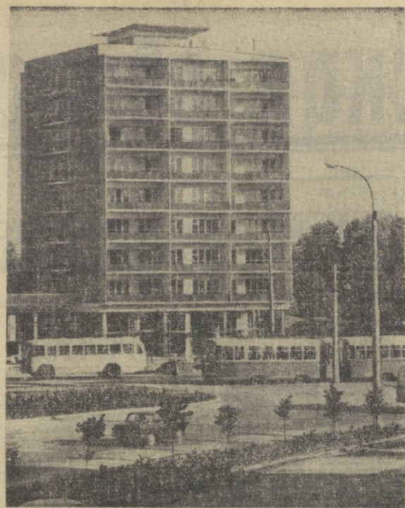
Приходит конец не только одиночному, но и одноэтажному Ташкенту. Столица республики растет вверх. Красивые, благоустроенные и прочие дома построятся в городе на 4, 9 и 16 этажей. В ближайшие дни примет новоселов первый высотный дом на Саперной площади, который и запечатлел на нашем снимке фотокорреспондент И. Глауверзон.