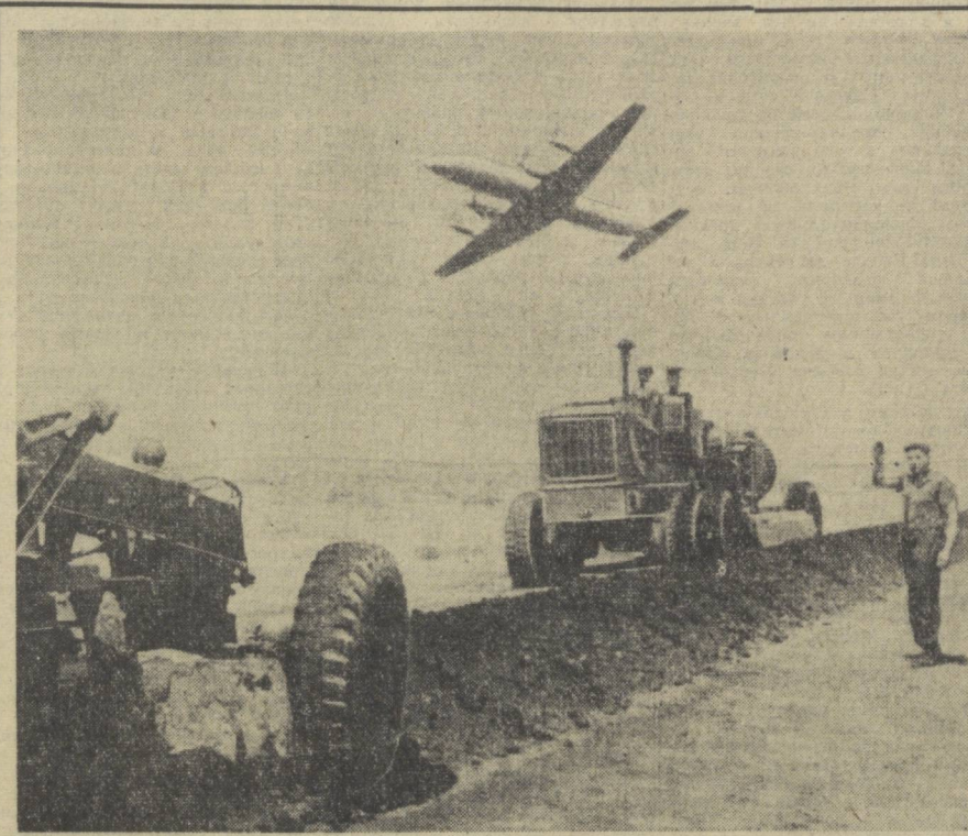
Строительство автомагистрали Гази-Сазакно.

Монтажники ускоренными темпами ведут работу газопровода на участке Мубарек — Зирабулак. В непрерывную нить огневых шагов сварены первые десятки километров. Проверка качества работы с помощью радиоактивных изотопов показала отличные результаты.