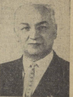
Ю. И. ПАЛЕЦКИС, Председатель Совета Национальностей.