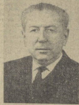
И. В. СПИРИДОНОВ, Председатель Совета Союза.