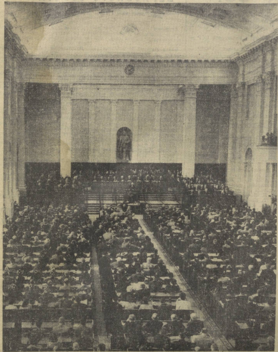
В зале заседаний Верховного Совета СССР.