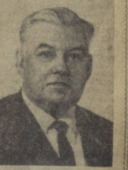
Л. С. СОБОЛЕВ, Заместитель Председателя Совета Национальностей.