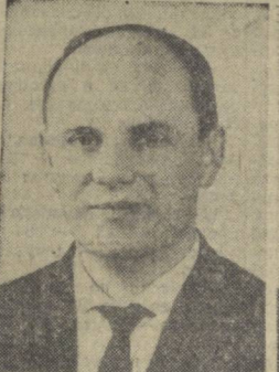
Б. Е. ПАТОН, Заместитель Председателя Совета Союза.