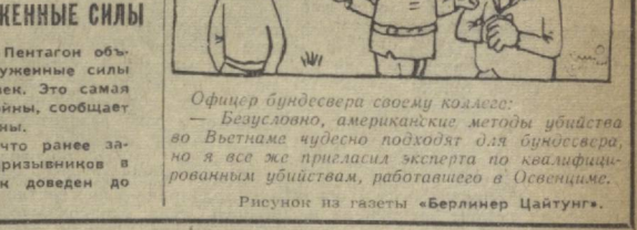
Офицер Bundesвера своему коллеге: — Безусловно, американские методы убийства во Вьетнаме чудесно подходят для Bundesвера, но я все же пригласил эксперта по тактико-тактическим убийствам, работающего в Освенциме.

САН-ХОСЕ, 5 АВГУСТА. (ТАСС). В Гондурасе больше во обводненных крестьянских семьях захватили существующие земли. Принадлежащие латифондистам помещицы заявили о том, что они намереваются вернуть свои владения силой. В ЭТИХ РАЙОНАХ СКЛАДЫВАЕТСЯ НАПРЯЖЕННАЯ ОБСТАНОВКА.