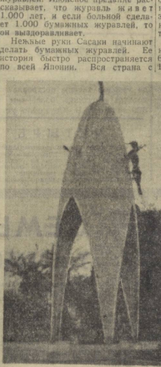
Памятник Тейко Сасаки.