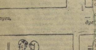
— А если уж говорить об этом, то я его пережала, и не вы.