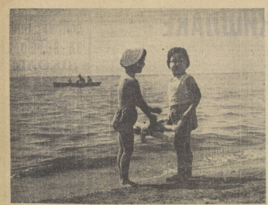
На озере Иссык-Куль.