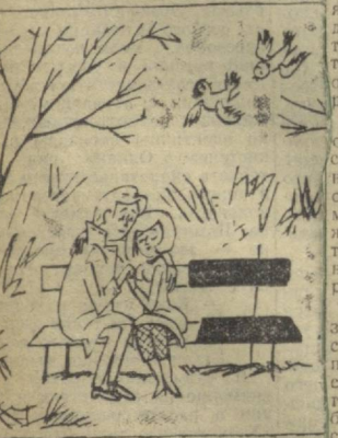
Простой по необходимости.