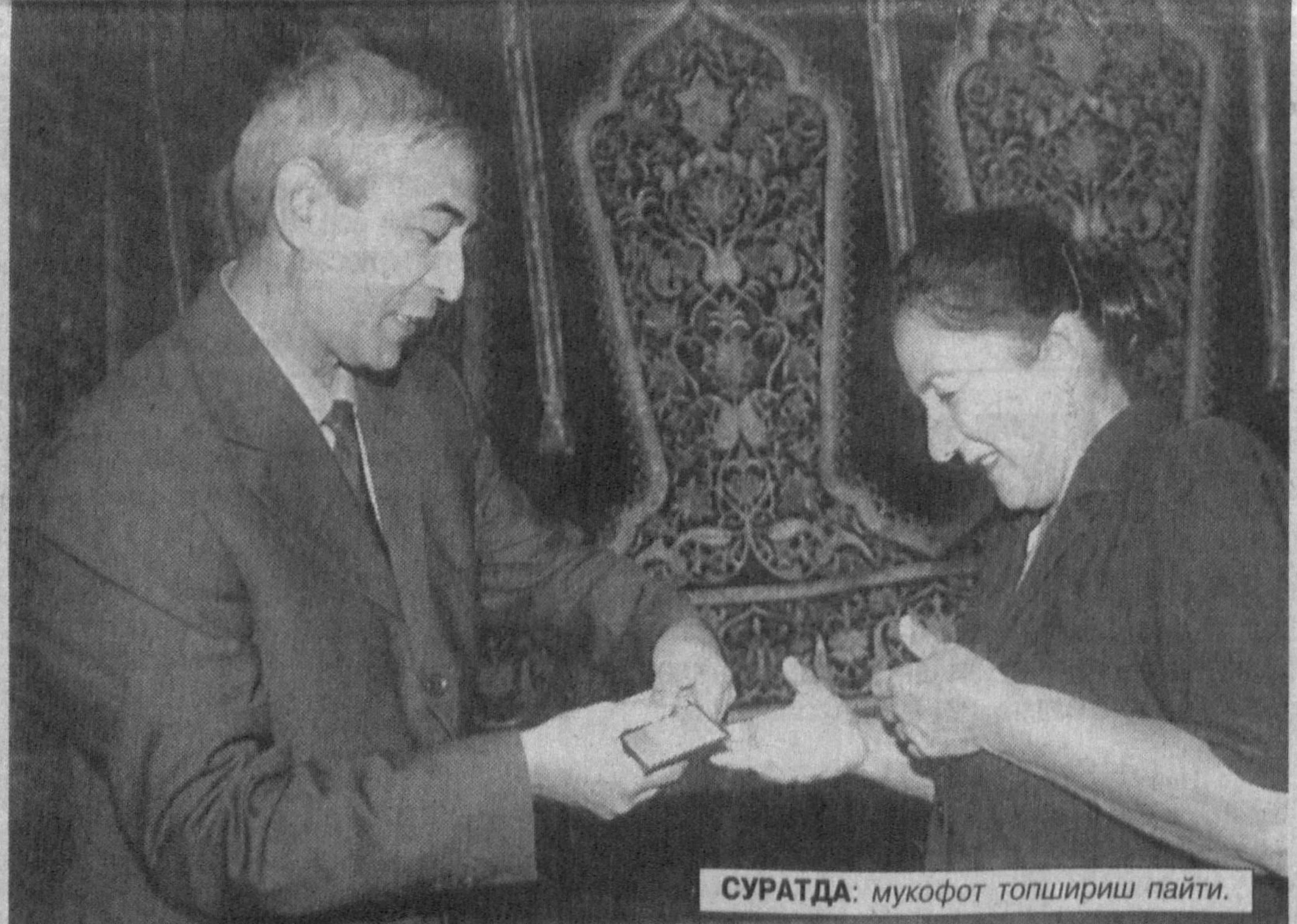
СУРАТДА: мукофот топшириш пайти.

Халқ таълими, касб-ҳунар ва ўрта-мах-сус таълим аълочиларига кўкрак нишонла-ри топширилди. Шунингдек, «Энг ораста кийинган ўқитувчилар жамоаси» кўрик-тан-лови ғолиби — Зангиотадаги 9-мактаб жа-моасига махсус мукофот, бир гуруҳ ҳомий-ларга «Таълим ҳомийси» кўкрак нишони, таълим ва фан ходимлари қасаба уюшма-си вилот кўмитасининг фахрий ёрлиқлари тақдим этилди.