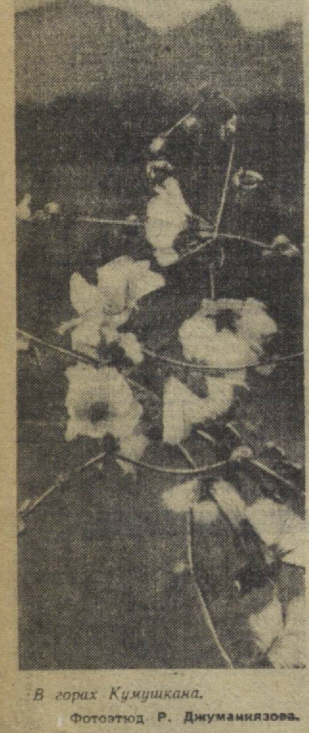
В горах Кумушканда.

В Ургенче состоялась розыгрыш четвертого выпуска денежно-вещной лотереи Узбекской ССР 1966 года. Разыграно 598,750 выигрышей на общую сумму в 877,500 рублей. Среди крупных выигрышей — автомашины «Москвич-408», мотоциклы, пианино, холодильники, телевизоры. Таблица будет опубликована в «Правде Востока» завтра, 1 сентября.