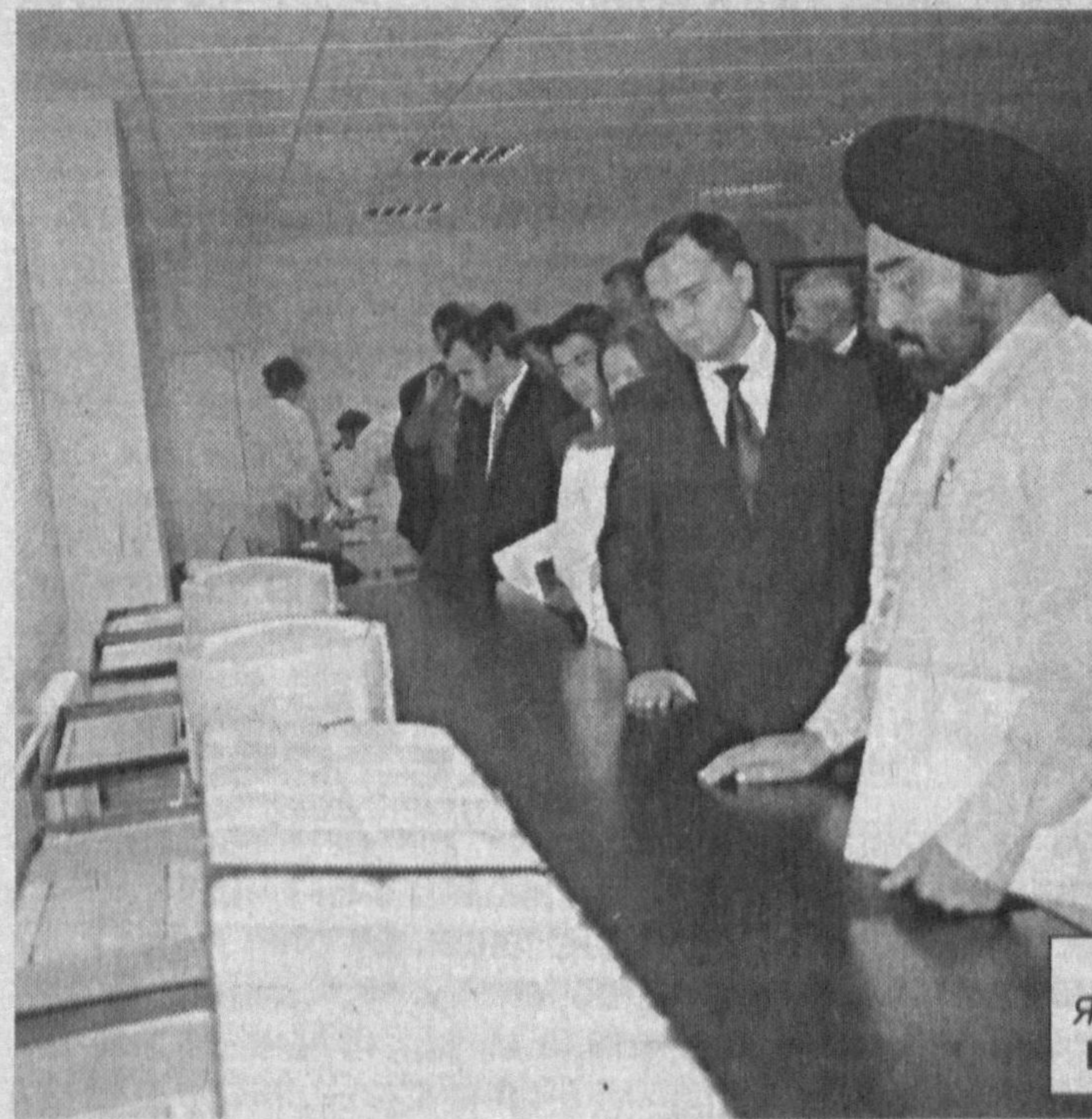
СУРАТЛАРДА: ярмарка иштирокчилари Янгийул туманида.