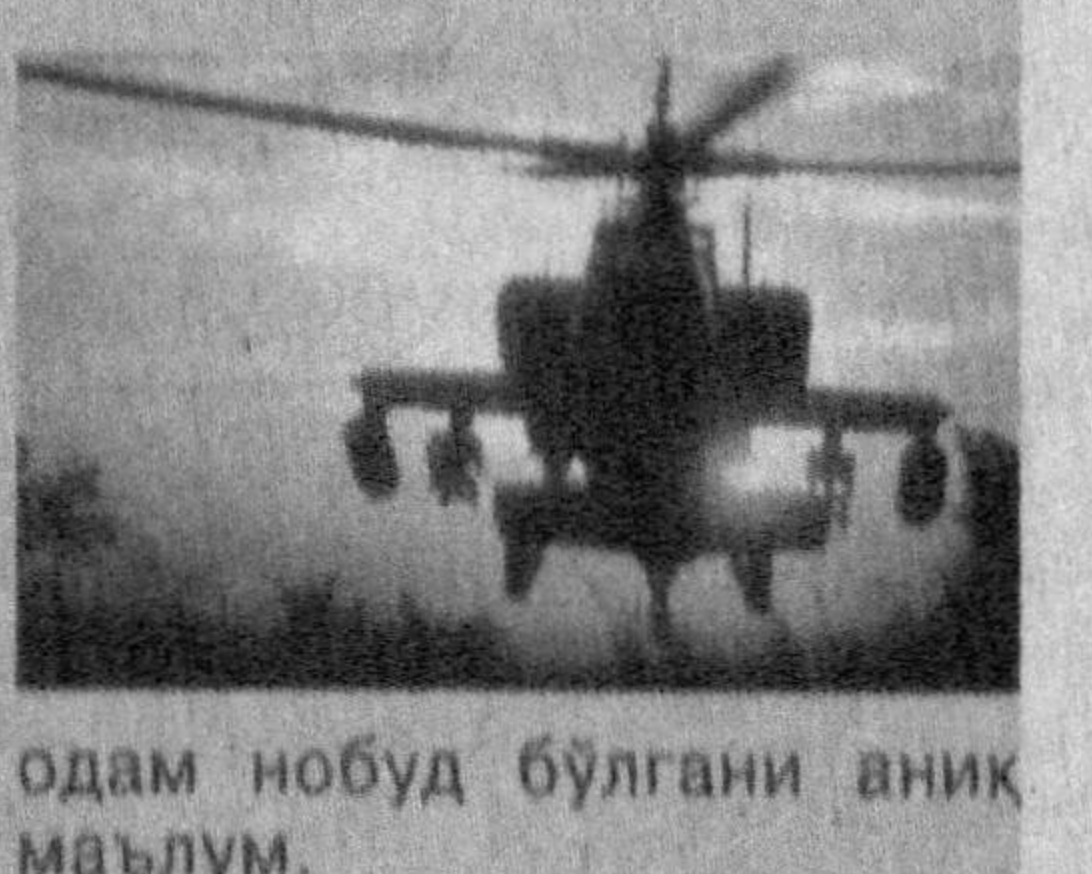
одам нобуд бўлгани аниқ маълум.

Улар зилзиладан азият чекаётган инсонпарварлик ёрдами юқларини элтиб бермоқда. Ҳукумат мазкур табиий офат туфайли ҳалок бўлганлар сони 53 минг кишидан ортиқ бўлиши мумкинлигини эътироф этмоқда. Ҳозиргача 40 мингдан зиёд