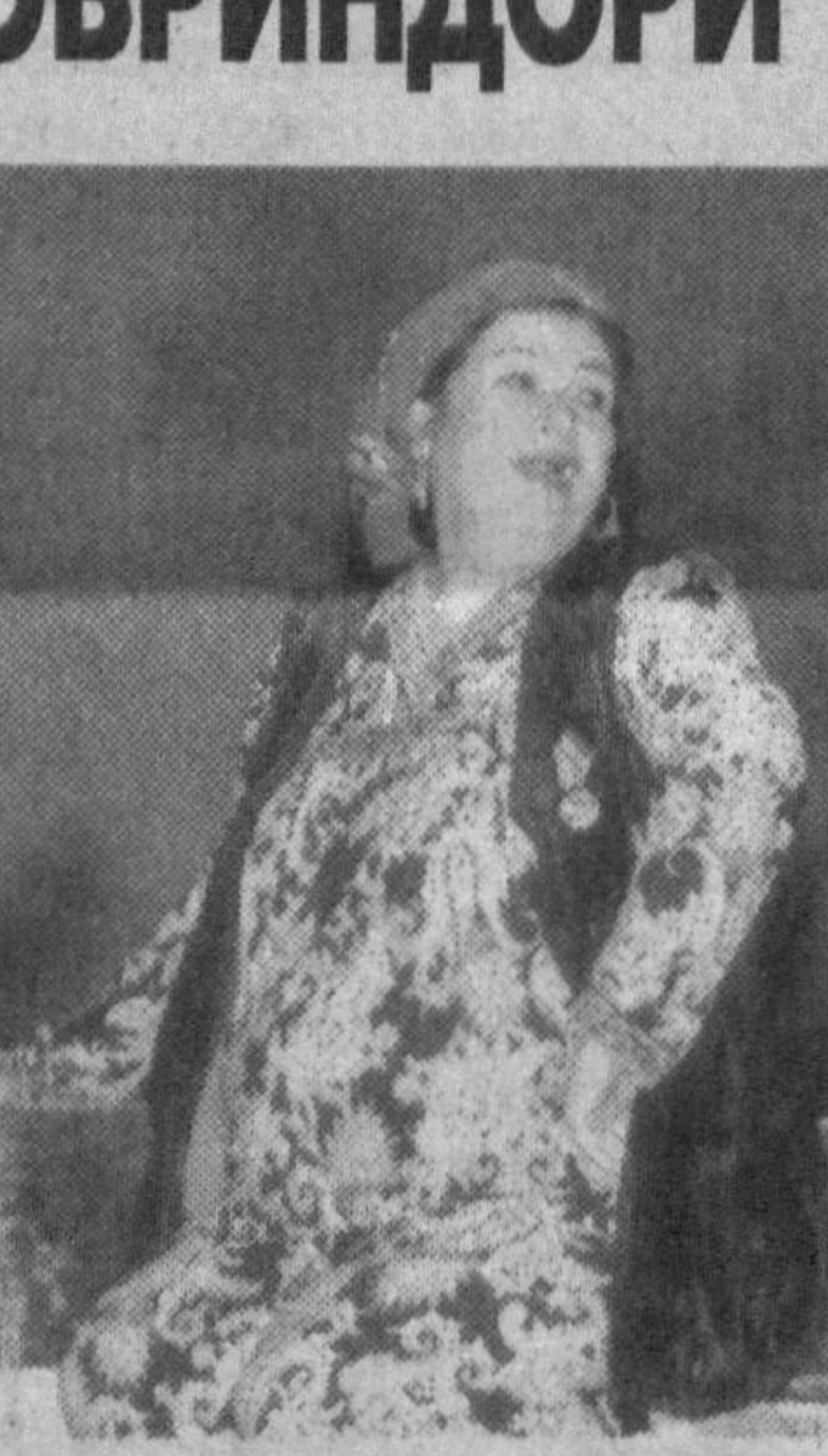
Миср Араб Республикаси пойтахти Қоҳира шаҳрида бўлиб ўтган ХVII халқаро театр фестивалида Мухимий номидаги Ўзбек давлат мусикали драма театрининг «Тўда» спектакли бир йўла икки совринга сазовор бўлди.