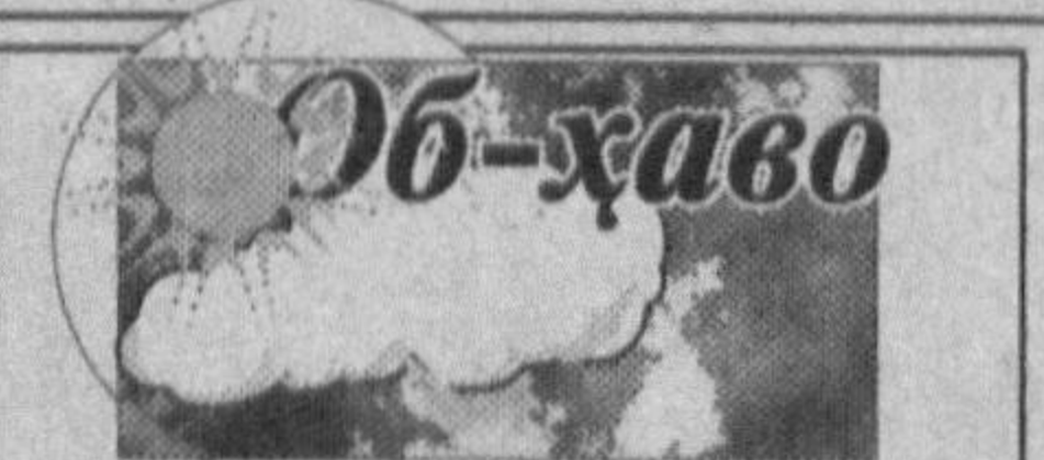
Гидрометеорология бoш бошқармасининг хабар беришича, 19 октябрь кунини Тошкентда ҳаво ўзгариб туради, ёнгарчилик бўлмайди. Шарқдан секундига 5-10 метр тезликда шамол эсади. Кечаси 7-9, кундузи 23-25 даража иссиқ бўлади.

Японияда хавфли ҳайвонларга микрочип ўрнатиш-мокчи. Ҳар ҳолда мамлакат фуқаролари уйларида сақланаётган йиртқичлар бундан холи бўлмадилар. Узунлиги бир сантиметр, қалинлиги икки миллиметр бўлган мосламага ҳайвон эгаси ва йиртқичнинг ўзи ҳақидаги маълумотлар ёзилади. Бу хил микрочипларни 650 турдаги ҳайвонлар териси остига жойлаштириш режалаштирилган.