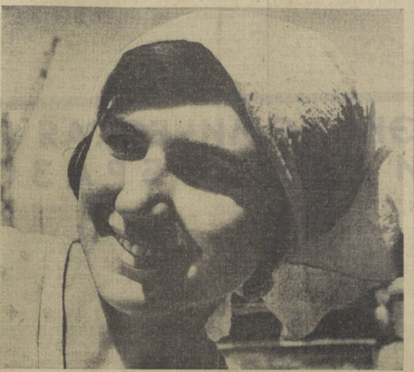
ОНИ СТРОЯТ ТАШКЕНТ Житомира, которую вы видите на фото А. Палекова.

Министр обороны СССР Маршал Советского Союза Р. Я. Малиновский подписал приказ об увольнении из Вооруженных Сил СССР военнослужащих и об очередном призыве на действительную военную службу. В приказе, в частности, говорится, что в связи с увольнением военнослужащих, выслуживших установленные сроки службы, призываются на действительную военную службу в Советскую Армию, Военно-Морской Флот, в пограничные и внутренние войска граждане 1947 года рождения, а также граждане призывных возрастов, у которых истекли отсрочки от призыва и сверстники которых проходят действительную военную службу. (ТАСС).