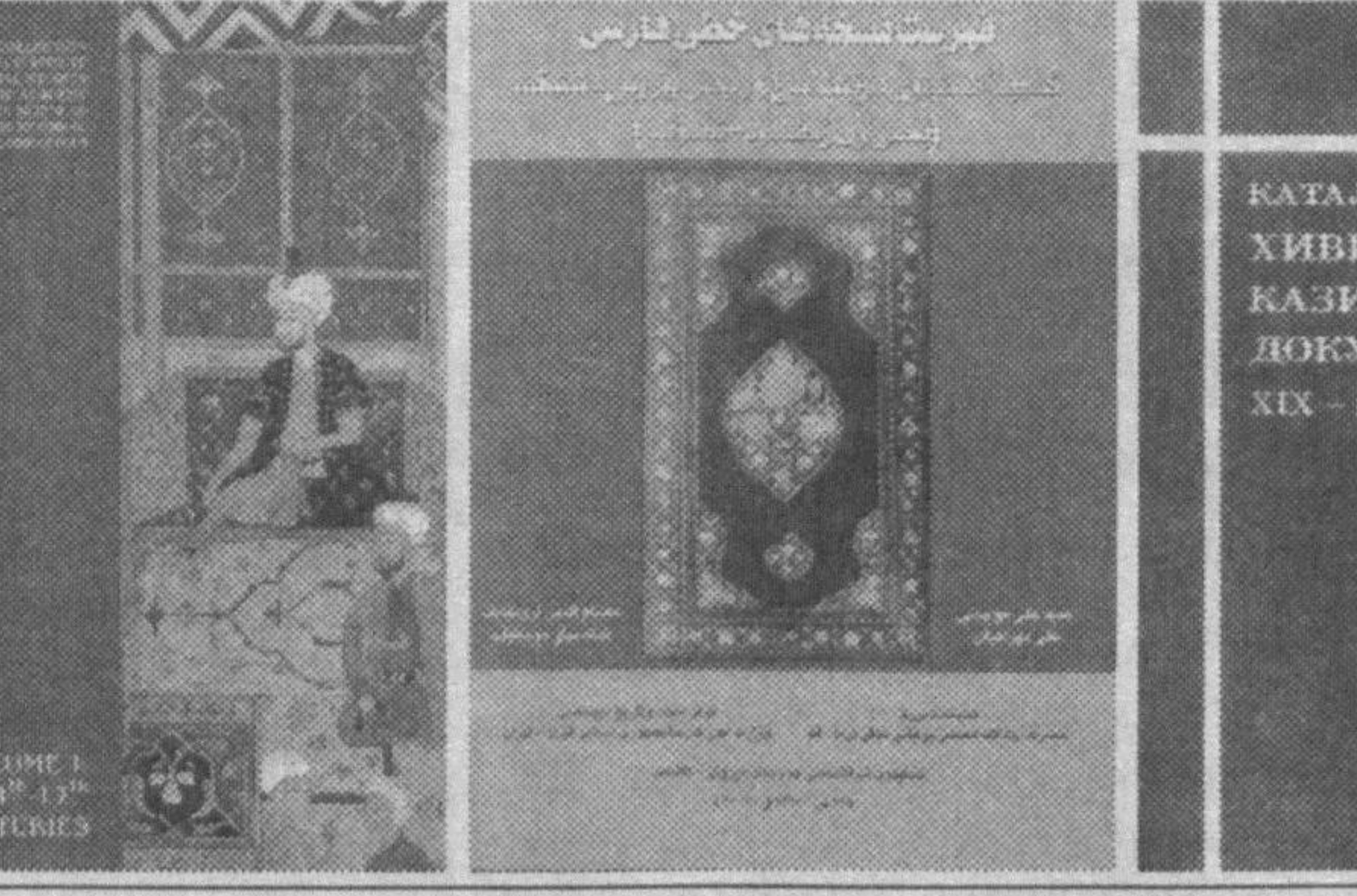
сасалари олиб бораётган тадқиқотлари натижалари билангина эмас, балки ўзларига тўплаган...