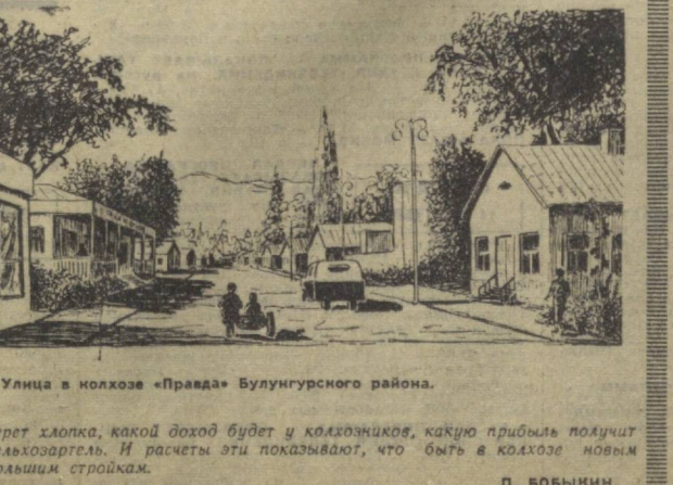
Улица в колхозе «Правда» Булунгурского района.

берет хлопков, какой доход будет у колхозников, какую прибыль получат сельхозартели. И расчеты эти показывают, что быть в колхозе новым большим стройкам. П. БОБЫКИН.