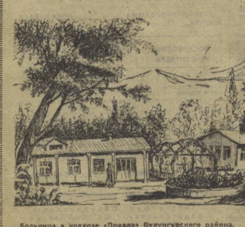
Больница в колхозе «Правда» Булунгурского района.