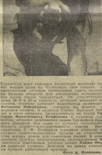
Строители всех союзных республик возводят сейчас жилые дома на Чингизовом. Они спешат...