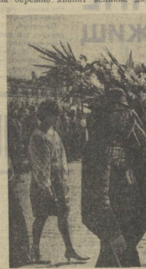
Возложение венка к Мавзолею В. И. Ленина.