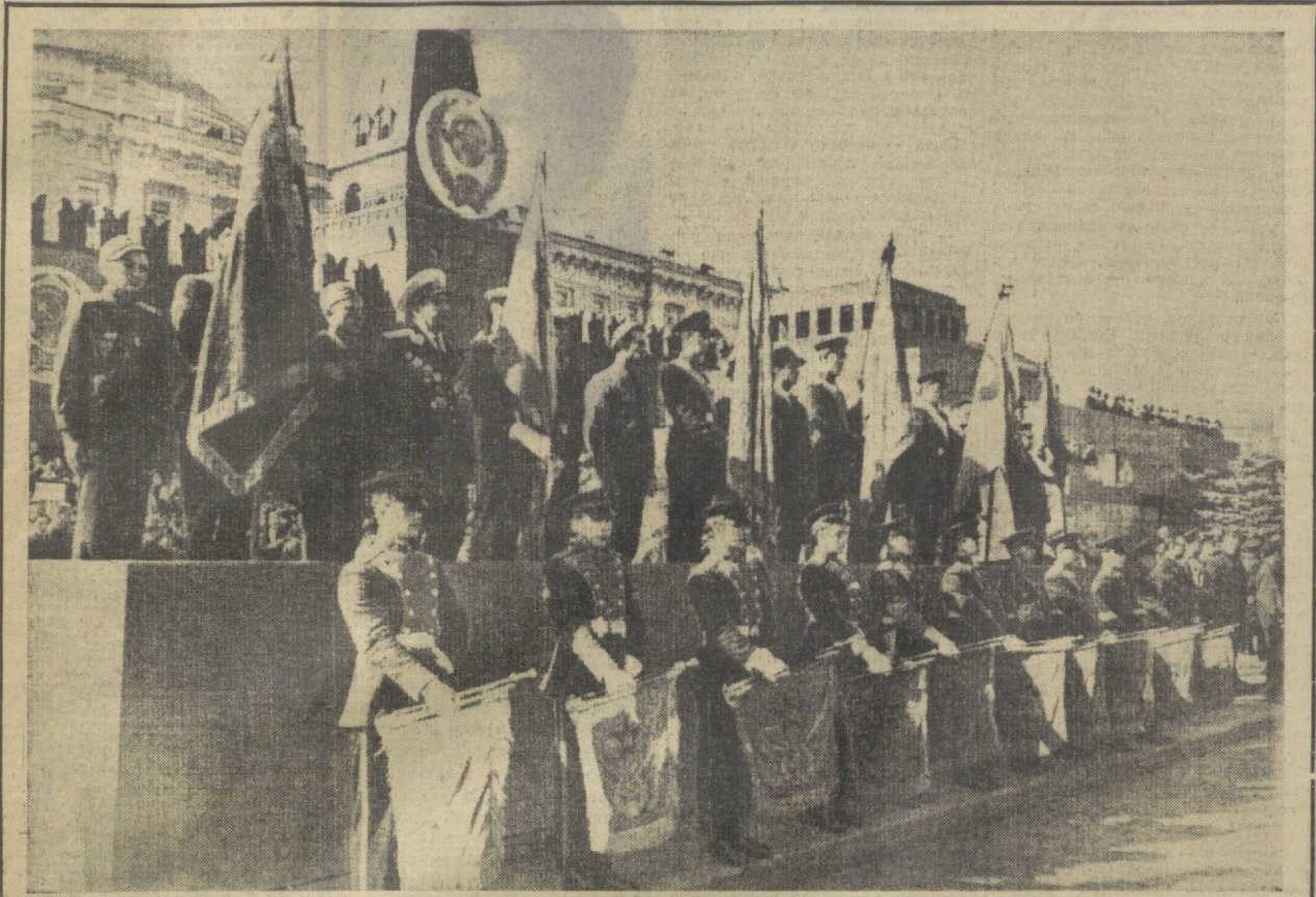
Митинг-клятва молодежи на Красной площади. У знамен, боевой и трудовой славы.