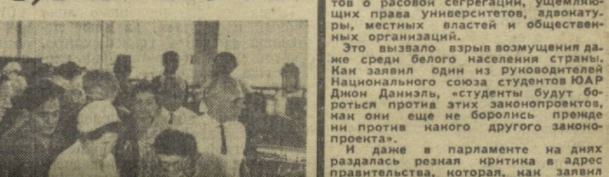
Радишно встретили трудящиеся Чирчика участников декады болгарской культуры. На снимке — участники декады на Узбекском комбинате тугоплавких и жаропрочных металлов.

Декада болгарской культуры в Узбекистане пришла 12 сентября в Голодную степь. У моста через Сир-Дарью дружок из братской страны встретили первый секретарь Сырдарьинского обкома партии Н. Махмудов.