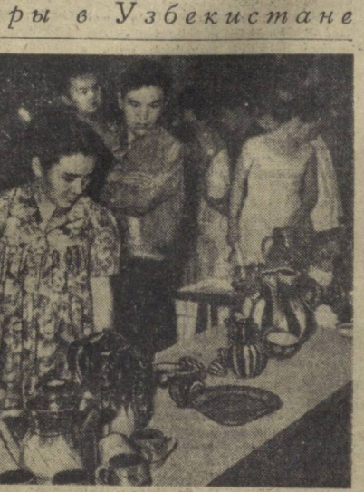
Большим успехом у трудящихся столицы республики пользуется выставка болгарского изобразительного и прикладного искусства, размещенная в одном из залов здания Министерства просвещения Узбекской ССР. На снимке: в зале выставка.

В колхозном саду зазвучали мелодии болгарских песен и танцев. Дружными аплодисментами были награждены артисты из Народной Республики Болгария, продемонстрировавшие свое высокое искусство.