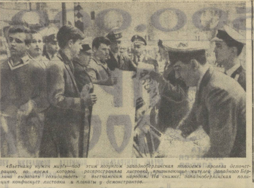
«Вьетнаму нужен мир!» — под этим лозунгом западноберлинская молодежь провела демонстрацию, во время которой распространяла листовки, призывающие жителей Западного Берлина выразить солидарность с вьетнамскими народом. На снимке: западноберлинская полиция конфискует листовки и плакаты у демонстрантов.