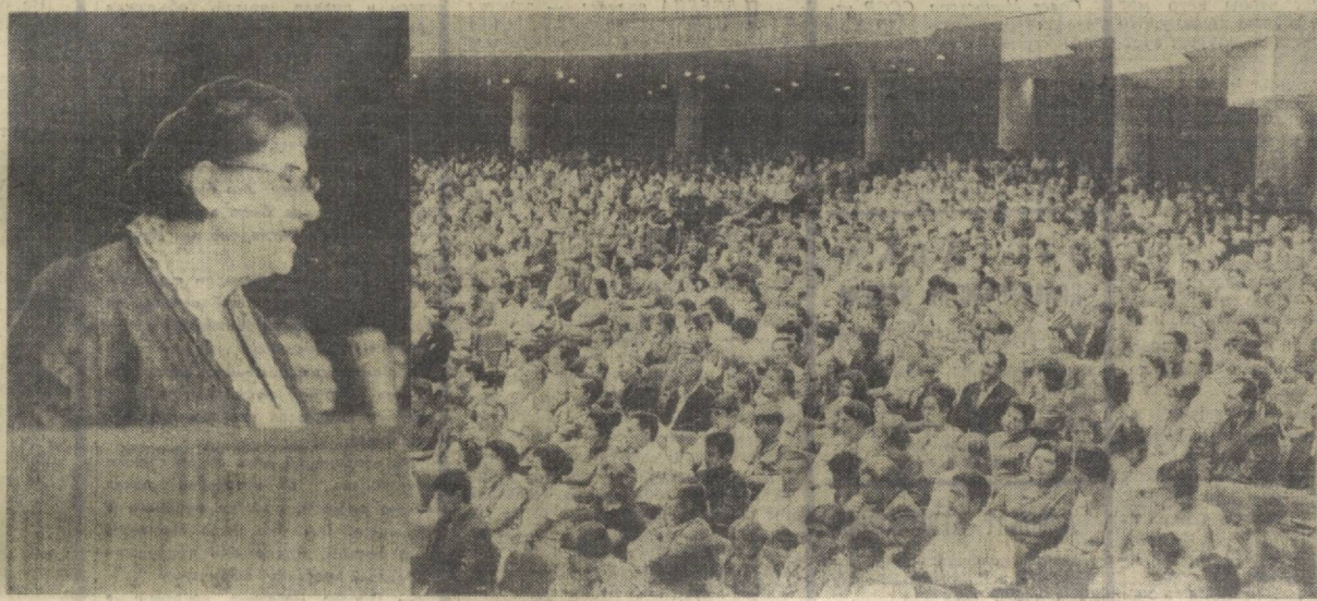
Дворец искусств. Зал заседаний. Выступает председатель Всенародного комитета болгаро-советской дружбы, член ЦК Компартии Болгарии Цола Драгоичева.