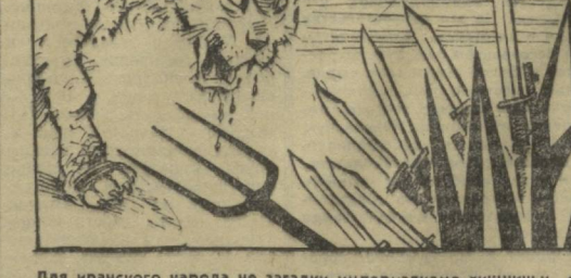
Для иранского народа не загадка империализма хищничества повадки. Рис. Б. ЖУКОВА.

Обозреватели думают, что западные печати о якобы плохом состоянии здоровья американских военнопленных, им регулярно передаются письма и подарки от близких из США. Они также имеют доступ к письмам и журналам, слушают радио и смотрят телевизор.