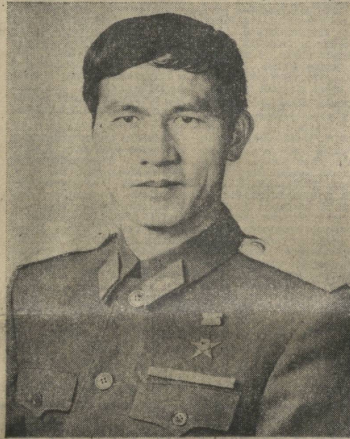
Космонавт-исследователь космического корабля «Союз-37», Герой Социалистической Республики Вьетнам ФАМ ТУАН.