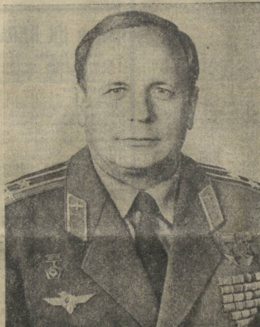
Командир космического корабля «Союз-37», летчик-космонавт СССР, дважды Герой Советского Союза Виктор Васильевич ГОРБАТКО.

Экипаж корабля «Союз-37» приступил к выполнению программы полета.