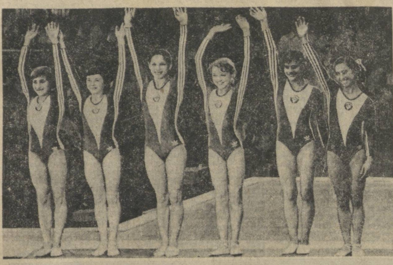
Вот они — наши золотые гимнастки.

Большое количество статистических данных, характеризующих ход Московской Олимпиады, было приведено 23 июля на традиционной пресс-конференции, состоявшейся в главном пресс-центре Игр. Только за три дня соревнований 34 раза были превышены олимпийские рекорды и двадцать пять раз — мировые. В итоге двенадцать результатов будут внесены в официальные книги рекордов мира как окончательные и девятнадцать — в олимпийские реестры. Объявив эти данные, первый заместитель председателя Оргкомитета Олимпиады-80 В. И. Попов, проводивший эту пресс-конференцию, даже сам несколько удивился — это было замечено почти четырьмястами журналистами — сколь впечатляющи эти цифры.