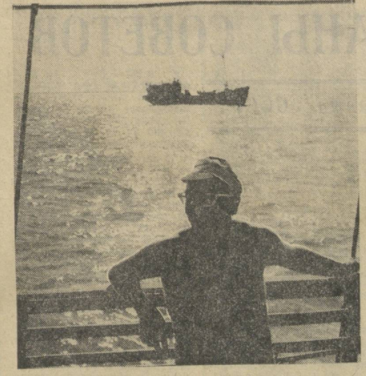
Около 10 000 трудящихся со всех уголков нашей страны проводят свое отпускное время в зоне отдыха на берегу Аральского моря. Отличный песок, ласковое море, теплое южное солнышко — это так приятно и взрослому и детям. На снимке — на борту прогулочного теплохода.