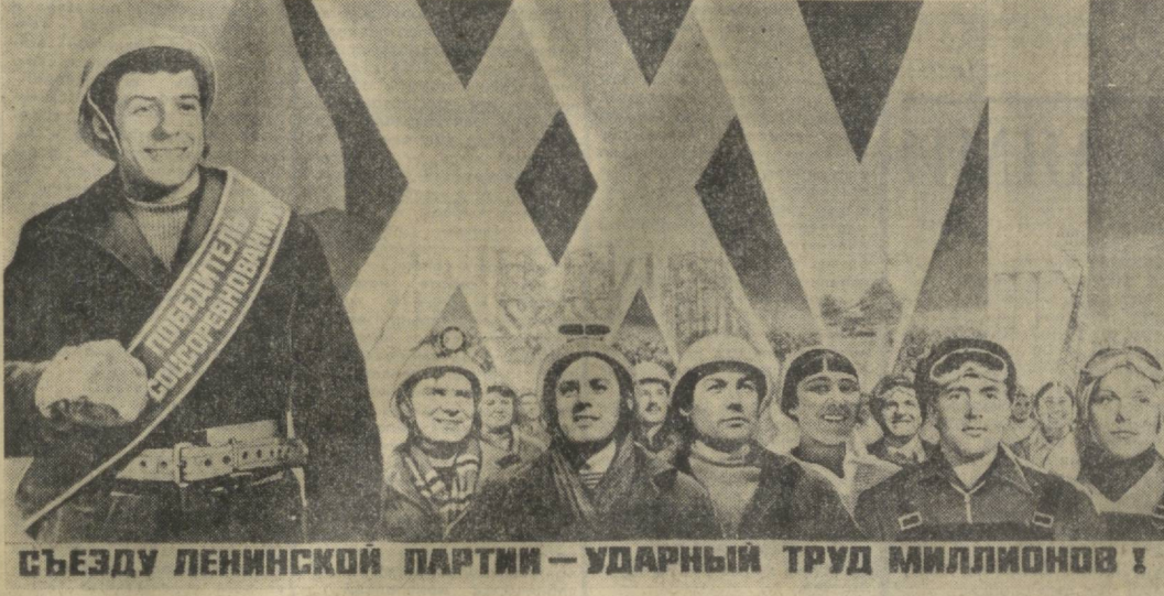
СЪЕЗДУ ЛЕНИНСКОЙ ПАРТИИ — УДАРНЫЙ ТРУД МИЛЛИОНОВ!

№ 174 (19351) • Воскресенье, 27 июля 1980 года • Цена 2 коп.