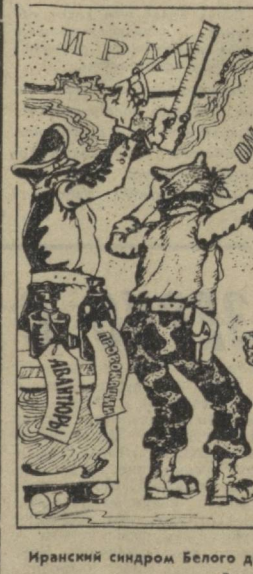
Иранский синдиром Белого дома. Рис. А. САФРОНОВА.

ВАШИНГТОН, 23 августа. (ТАСС). На заседании сенатского комитета по расследованию незаконных связей брата президента Картера с иностранным государством, выступил с показаниями сам знаменитый скандалист — Билла Картер.