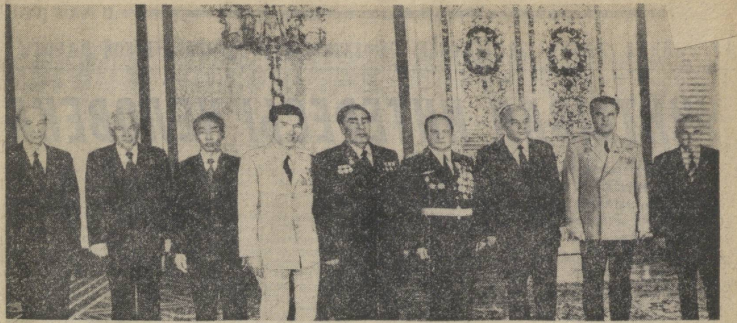
При вручении наград.