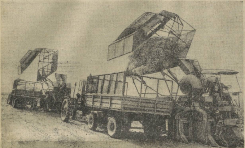
К механизированному сбору хлопка приступили земледельцы совхоза имени З. Аминджана Бухарского района. На поле выведено 18 хлопкоуборочных машин. Дело здесь организовано по ипатовскому методу. Созданные