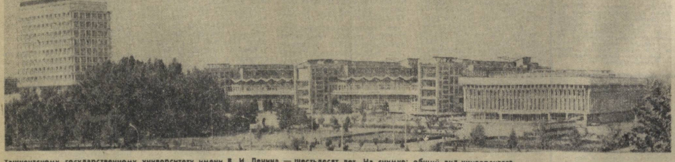
Ташкентскому государственному университету имени В. И. Ленина — шестьдесят лет. На снимке: общий вид университета.

УРГЕНЧ. (Соб. корр.). На всех полях с семенным хлопчатником в колхозе имени Ахунбабаева Ханжикского района работают борщицы. Они получили инструктаж сортировать хлопок, и бригадиры, агрономы, табельщики строго следят за выполнением этого требования, чтобы хозяйство поставило только отличный сырец. Нормы несколько снижены, хлопчатник уродился отличным, и мастерам скорости сбора легко первовыполняют задания. В соревнование многотысяч-