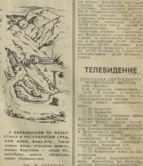
Рис. И. ЦЫГАНОВА.

Сегодня днем по Узбекистану ожидается небольшая облачность, без осадков. Ветер по Бухарской, Самаркандской и Кашкарской областям северозападный, по Сурхандарьинской области и Ферганской долине западный. 5-10, по южной части республики северо-восточный. 2-5 м/с. Температура по Каракалпакии и Хорезму 21-28, по остальной территории 26-33 градуса. В Ташкенте — небольшая облачность, без осадков. Ветер северо-западный, 2-7 м/с. Температура 20-31 градус.