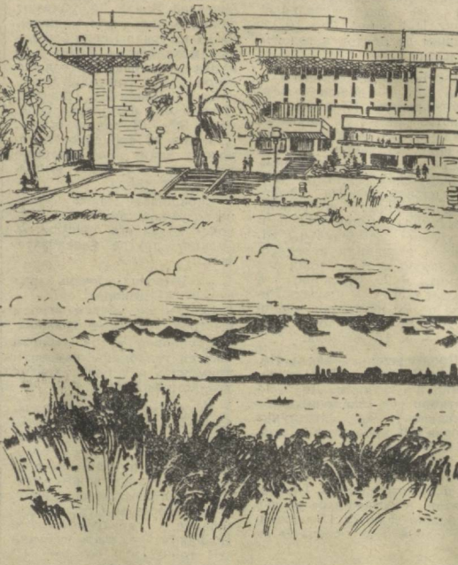
С КАРАНДАШОМ НА КАЗХАНСКОМ И РЕСПУБЛИКАМ СРЕДНЕЙ АЗИИ, АЛМА-АТА. Театр имени Абай; «Голубая жемчужина» Киргизии — озеро Иссык-Куль; шахта «Шаргуна» (Узбекистан).