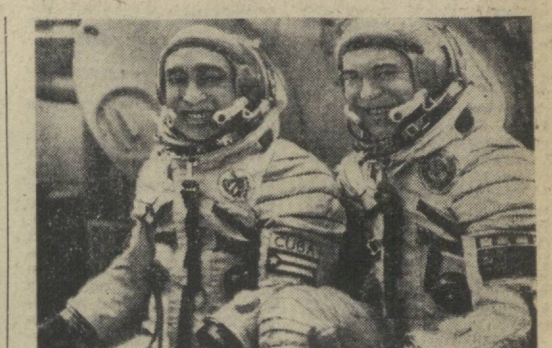
Командир международного экипажа космического корабля «Союз-38», летчик-космонавт СССР, Герой Советского Союза полковник Ю. В. Романенко (справа) и космонавт-исследователь, гражданин Республики Куба Арнальдо Тамайо Мендес во время предполетных занятий в Центре подготовки космонавтов имени Ю. А. Гагарина.

Экипаж орбитального комплекса «Салют-6» — «Союз-37» — «Союз-38» Л. ПОПОВ, Л. РЮМИН, Ю. РОМАНЕНКО, А. ТАМАЙО МЕНДЕС.