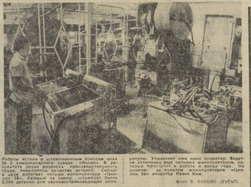
Работы встали и штамповочным прессом цеха № 2 самаркандского завода «Кинжал». В результате резко возросла производительность труда, повысилось качество деталей. Сейчас в цехе работает четыре манипулятора «Цинлон 3Б». Каждый за смену штампует более 2.000 деталей для вновьоснащенной аппаратуры.