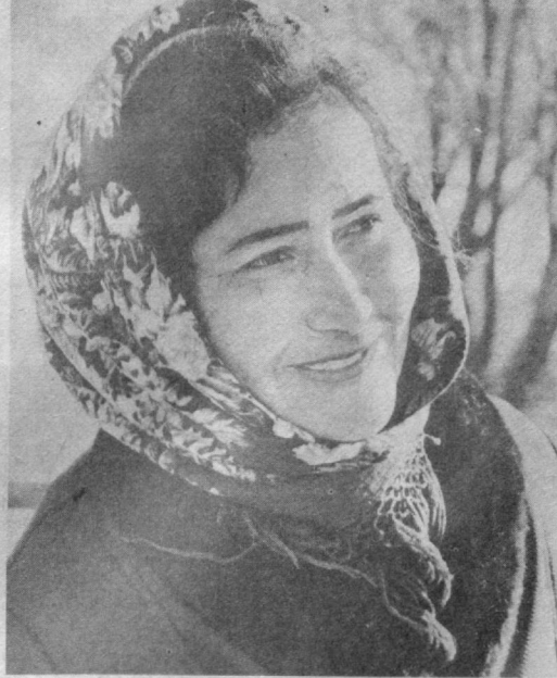
Наше хозяйство недавно расширилось — присоединился соседний колхоз «Галаба». Площадь под хлопчатником увеличилась. Несмотря на это, коллектив успешно завершил прошлый год — поставил на областную бирману 4,280 тонн сырья, что на 627 тонн больше, чем предусматривалось. Средняя урожайность — а у нас галечниковые земли — достигла 30 центнеров.

В ПОЛЕ—ХОТЬ СЕГОДНЯ Последний трактор поставлен на линейку готовности в наманганском колхозе имени XXII партсъезда. Все машины испытаны под нагрузкой. Качество их ремонта — высоко. Подготовлены к весне также все сеялки и культиваторы. Ускоренно ремонта техники способствовали органи-