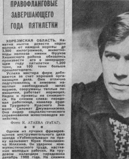
Ю. КУЗЬМИН. Собр. корр. «Правды Востока».