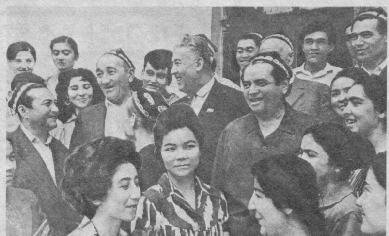
Плодотворно работал Айбек в большой прозе и в последние годы. В 50-е годы вышли романы «Ветер золотой долины» и «Солнце не померкнет».

его жизни и творчеству, обещая в большой прозе и в последние годы. В 50-е годы вышли романы «Ветер золотой долины» и «Солнце не померкнет». В автобиографическом повести «Детство», изданной в 1963 году, предстают картины жизни узбекского народа, его созидательный труд. Большой знаток узбекской классической и современной литературы, крупный исследователь, ученый широкого диапазона и тонкого эстетического чутья, Айбек посвятил жизни и творчеству Алишера Навои, Абдуллы Кадиря, узбекской поэзии и литературной критике, великим русским писателям исследования, сыгравшие важную роль в росте реалистической мастерства наших писателей и в развитии литературной критической мысли в Узбекистане. Научные труды, посвященные эпохе Навои,