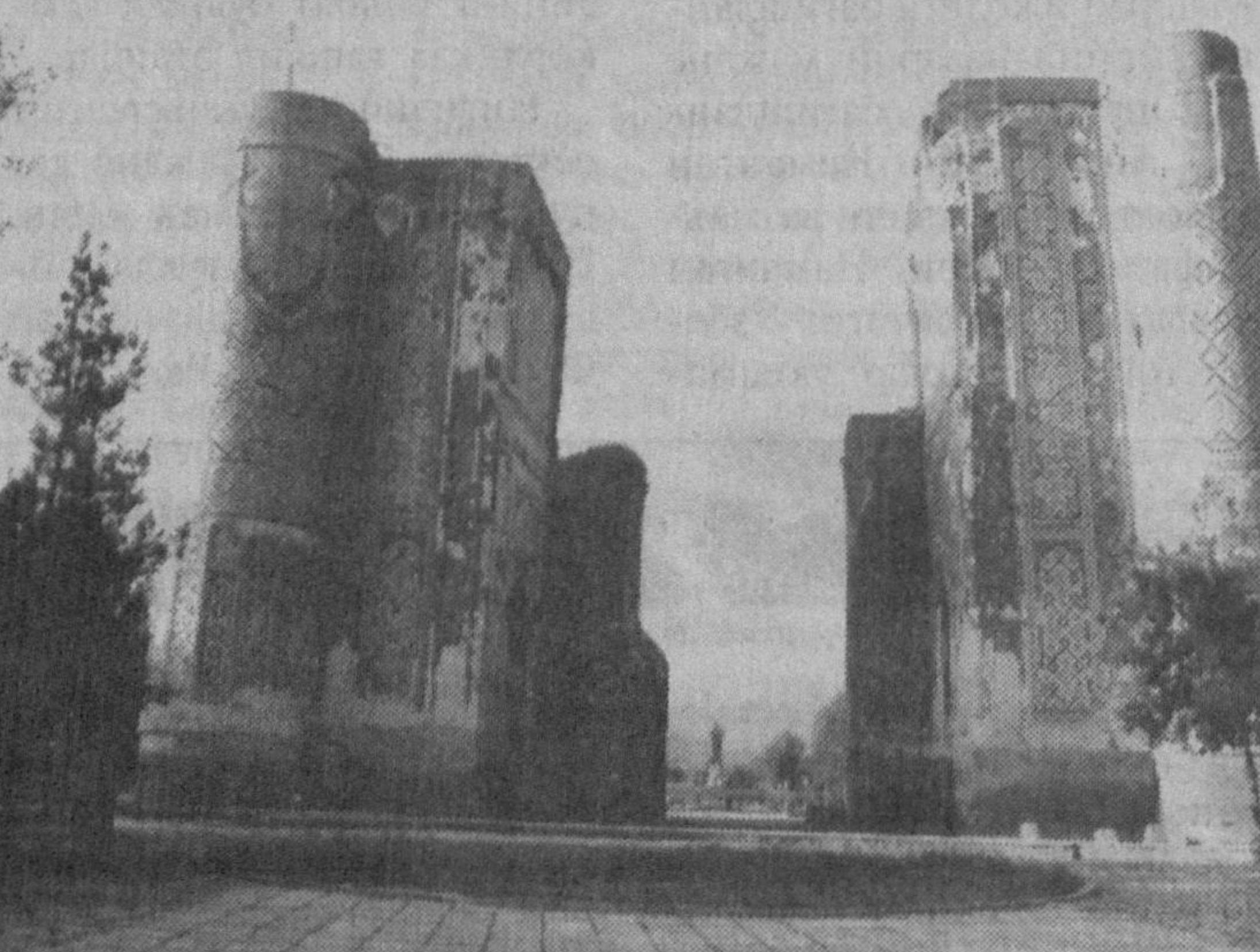
Тўхтовсиз бузиб келинганлиги «илмий» томондан асосланади (39-бет).

Бундан қарийб 1000 йил илгари буюқ тилшунос олим Маҳмуд Кошғарий (XI аср) она юртидаги ўша давр туркийлаги сўз хазинасини «Девону лугатит-турк» шоҳ асарига жамлаганда 300га яқин мақол ва маталларни ҳам намуна тарзда келтирган. Шулардан икки ўринда изоҳ учун келтирган бир мақолни кўрайлик: «Тотсиэз турк бўлмас, бошсиз бурк бўлмас» (I, 333-бет). Мақолнинг тўлиқ маъносини келтирадиган бўлсак, гап чўзилди кетади. Ҳозирча фақат меъморий бурк — гумбаз билан боғлиқ воқеани Шаҳрисабздаги ажайиб ёдгорликлар мажмуидан биттаси мисолида эслаб ўтиш kifойдир. Бошқача айтганда, халқ орасида «Ҳазрати Имом» номи билан машҳур улкан бинонинг сақланиб қолган ягона конуссимон кулоҳий бурки — гумбаз ҳақида гап боради.