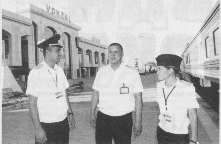
К 25-й годовщине независимости введено в эксплуатацию реконструированное здание главных северных ворот страны - Нукусского железнодорожного вокзала.

Транспортная система поэтапно развивается и модернизируется, открываются новые маршруты, создается современная инфраструктура. Основная часть международных и внутренних пассажиро- и грузоперевозок приходится на железнодорожный и автомобильный транспорт. В годы независимости открыто несколько внутренних скоростных линий, налажены грузоперевозки в разные страны. Ввод Нукусского вокзала стал значимым пунктом в рамках модернизации железнодорожной сферы. Здание, построенное в 1976 году, было капитально реконструировано. Площадь перед ним превратилась в аллею с фонтаном, декоративными деревьями и цветниками.