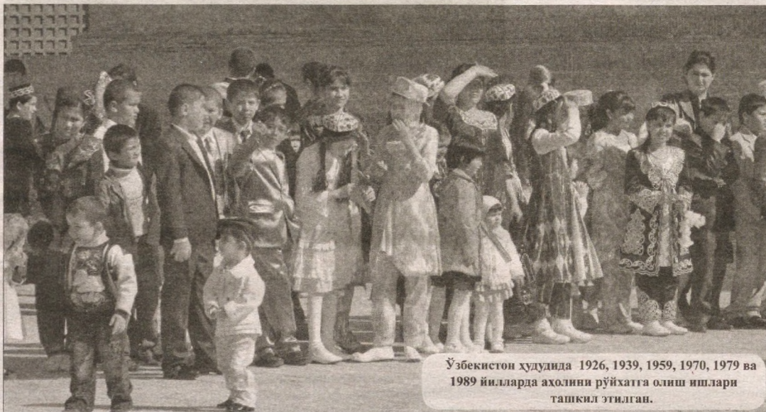
Ўзбекистон ҳудудида 1926, 1939, 1959, 1970, 1979 ва 1989 йилларда аҳолини рўйхатга олиш ишлари ташкил этилган.

2022 йилда аҳоли рўйхатга олинади, бу нима учун керак?