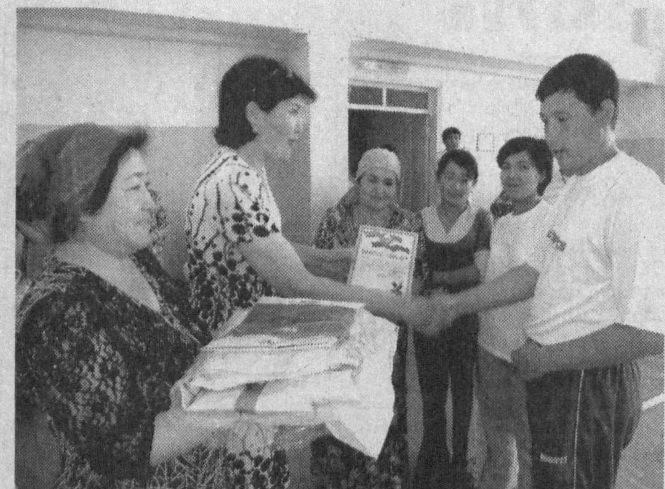
СУРАТААРАА: мусобақалар давомида иштирокчилар спорт катта куч эканлигига амин бўлишди.

ОИЛАЛАРДА СОҒЛОМ турмуш тарзини шакллантиришда "Отам, онам ва мен - спортчилар оиласи" мусобақалари катта роль ўйнамоқда. Ана шундай мусобақаларнинг навбатдаси Қўбрай туманидаги Байтўғрон хизмат кўрсатиш ва иқтисодий касб-хўнар коллежиде бўлиб ўтди.