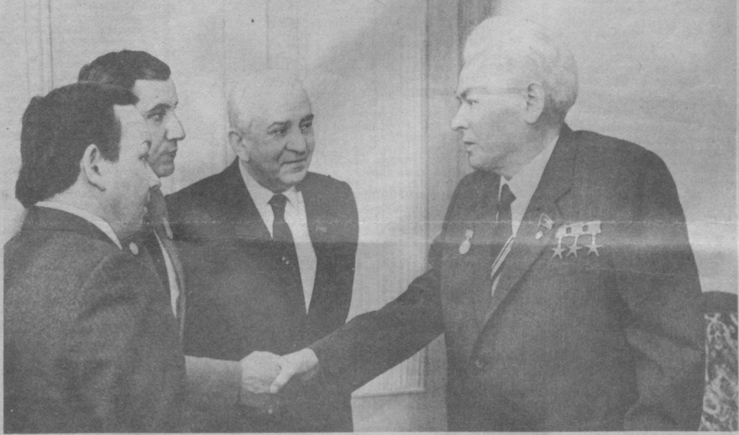
Во время вручения.