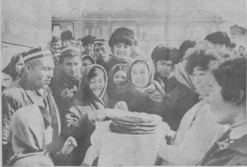
Хлебом-солью встречают энтузиастов из Ферганской области в совхозе имени Дзержинского Мехнатабадского района.