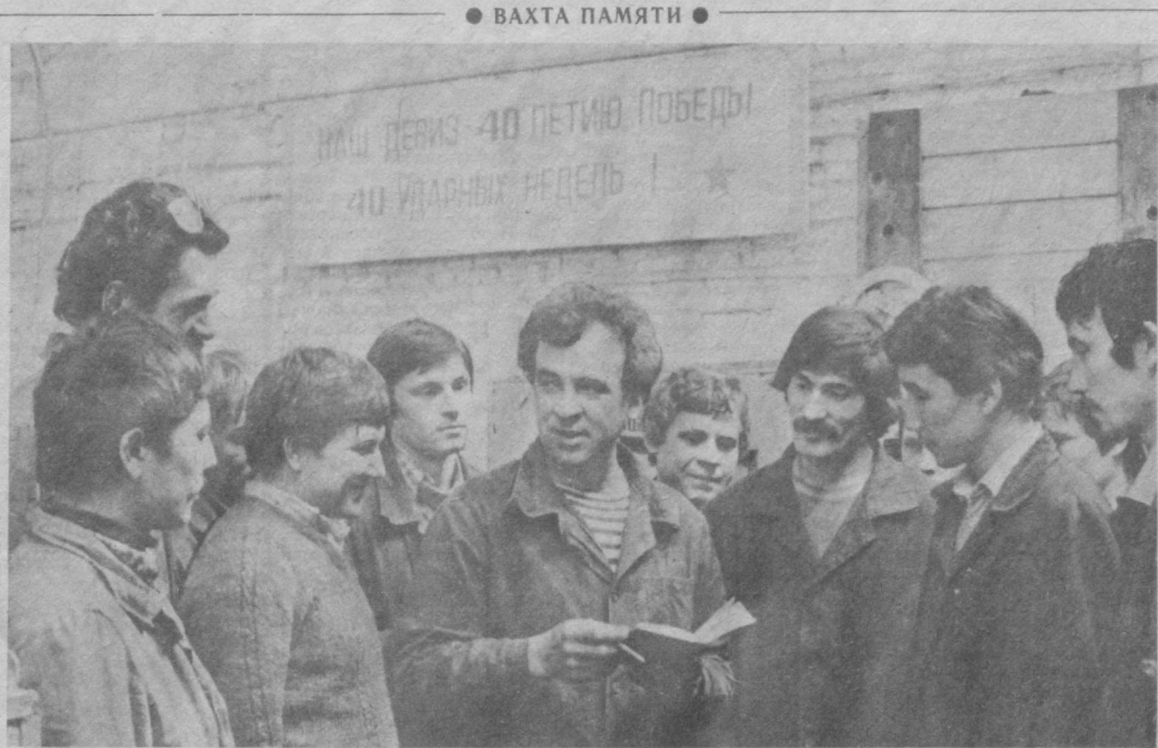
• ВАХТА ПАМЯТИ •