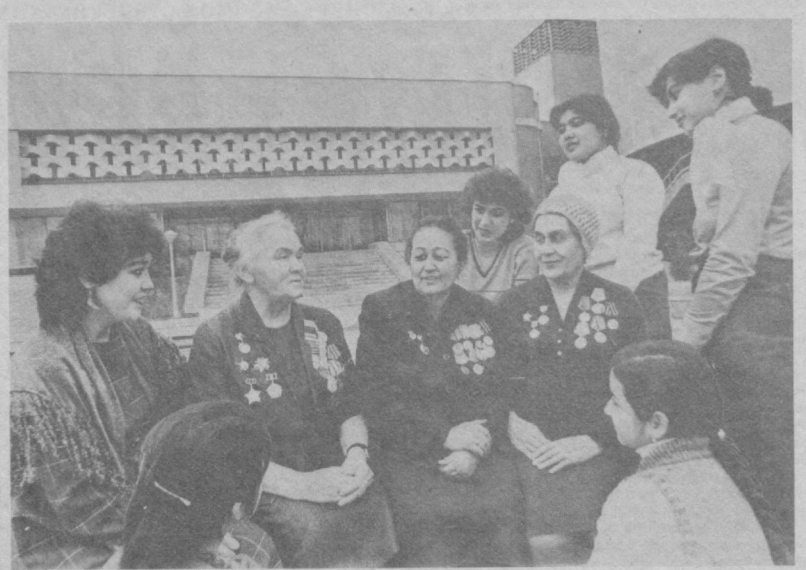
Им есть что рассказать молодым. За плечами трудные годы Великой Отечественной войны. Тогда они были военными врачами, делали свое тяжелое, родное дело. Сейчас они часто встречаются с молодежью, делятся своими воспоминаниями о войне.

Ограниченный контингент советских войск в ДРА.